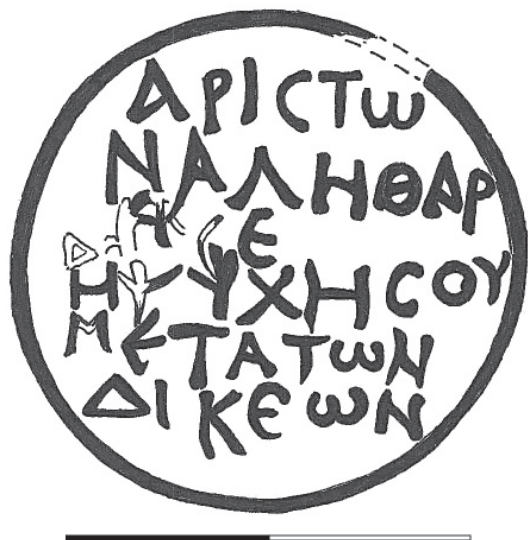
Рис. 1. Напис грецькою, нанесений червоною фарбою в колі у склепі 2002 р., за Є.Я. Туровським та А.А. Філіппенко

і використовували для численних поховань (Зубарь 1982, с. 26—27; Сорочан 2005, с. 1040—1051), датування їхнього розпису не може ґрунтуватися лише на речах або монетах, виявлених у процесі розкопок. Не можна визначати дату християнського живопису, спираючись лише на ці предмети, оскільки вони могли належати до інвентаря раніших поховань.