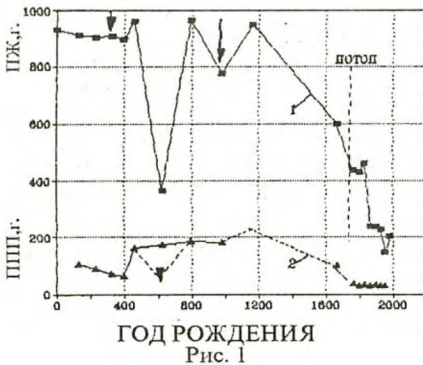
Продолжительность жизни Адама и препродуктивного периода Адама и его потомков от даты рождения

Согласно Библии «Всех же дней Еноха было триста шестьдесят пять лет. И ходил Енох перед Богом; и не стало его, потому что Бог взял его» (гл. 5, 23, 24); в отношении же других фигурантов в гл. 5, 11 однозначно указано «и он умер». Учитывая это, а также наличие и содержание апокрифической книги Еноха (цит. по (14)), свидетельствующей о том, что Енох не умер в 365 лет, и проводя сопоставительный анализ рис. 1 и 2, был сделан вывод о том, что Еноху намеренно «оставили» 365 лет в тексте гл.5 для того, чтобы показать «большой провал» на кривой 1 рис.1. А чтобы при этом не нарушить «идеальность» прямой 2 рис.2, Еноху также намеренно занизили реальную ППП (действительно, прямая 2 на рис. 2 не «откликается» на наличие двух минимумов, расположенных на соответствующем ей отрезке кривой 1 рис. 1). На самом деле, ППП Еноха должна была быть близкой к ППП его отца (Иаред) и сына (Мафусаила). Поэтому реальная ППП Еноха может быть ориентировочно принята как средняя между ППП его отца и сына; т.е. равной (187+162):2=174,5 года — на 109 (174,5 — 65) года больше, чем указано в гл.5. Таким образом, начиная с рождения Мафусаила, все библейские допотопные даты были передвинуты вперед на 109 лет. Корректность этой поправки вытекает из следующих данных.