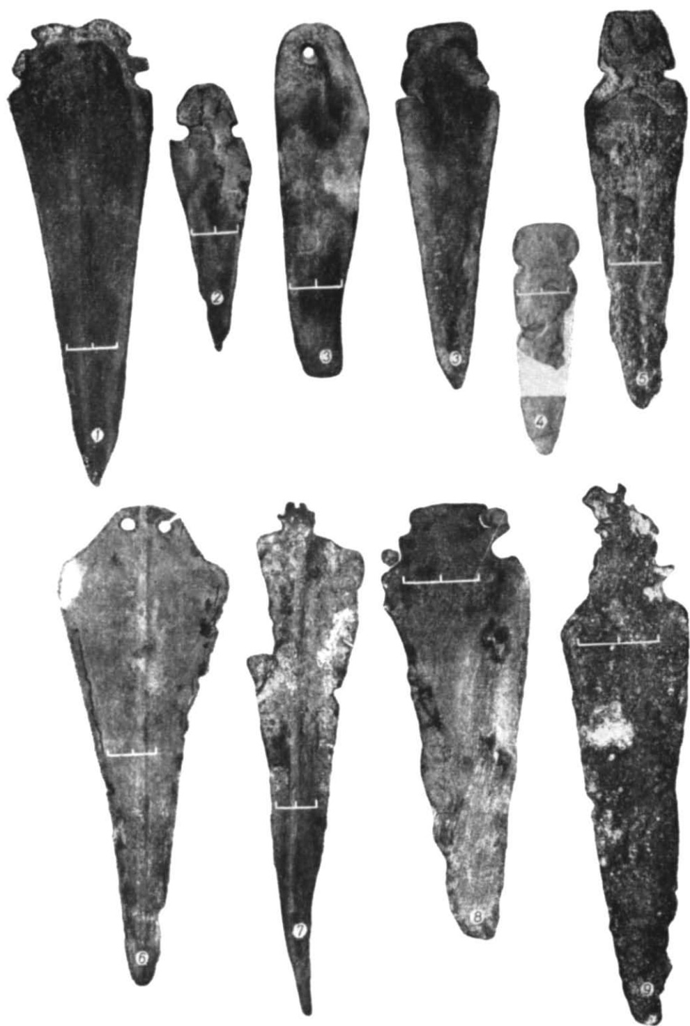
Табл. I. Мідні киджали усатівського типу.