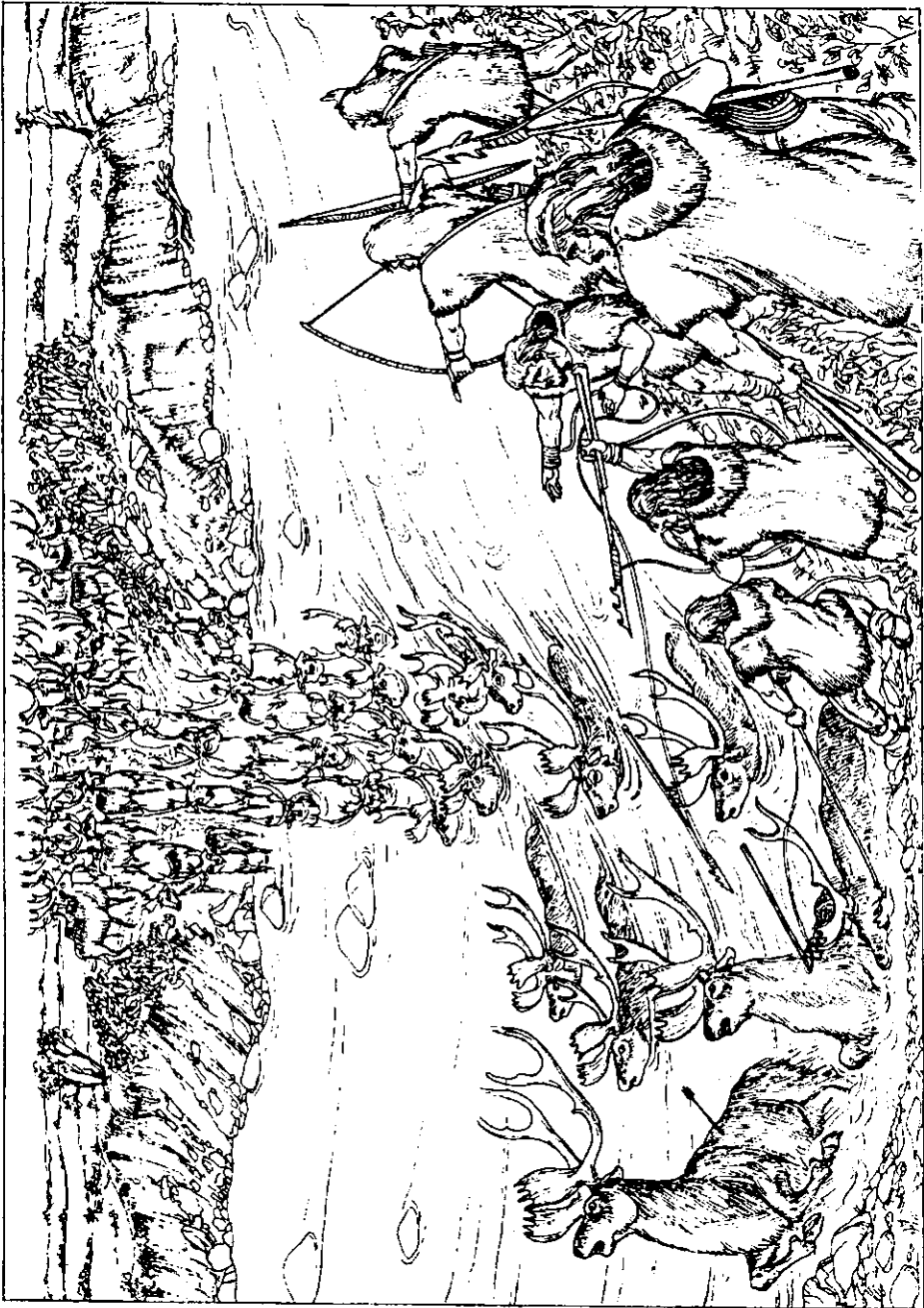
Рис. 3. Полювання на мігруючих оленів на річковій переправі у фінальному палеоліті.