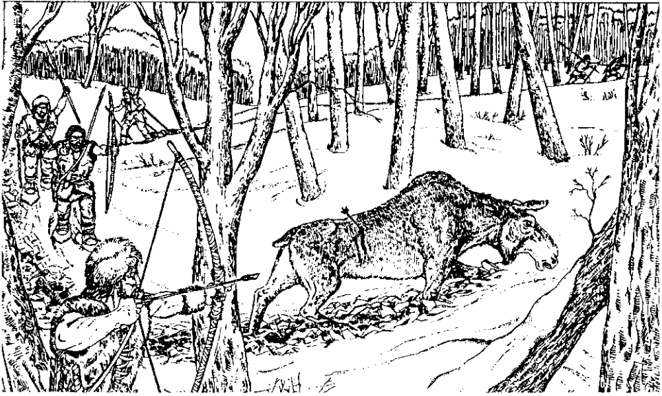
Рис. 4. Полювання на лося в зимовому лісі у мезоліті.

териофауною (перш за все тура) збільшило роль індивідуального полювання з луком та стрілами. Фактично на півдні України в мезоліті був поширений варіант степової моделі адаптації з елементами лісового мисливського господарства.