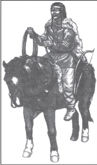
Мал. 2. Гунський вершник V ст. Реконструкція

Головним заняттям гунів залишалась, природно, війна. Недарма Марцеллін називає їх «acerrimi bellatores» – «найлютіші воїтели» [1, XXXI, 2,9]. Більшість воєнних кампаній V ст. не обходила без гунської кінноти (див. мал. 2). Вже в 387 р. Амвросій, єпископ Медіоланський, згадує гунів-найманців [16, Ер. XXIV, 8], а один з панегіристів у 389 р. вихваляє державну мудрість імператора Феодосія I Великого, який поставив колишніх ворогів під знамена Рима [25, XII (2), 32]. Збереглося цікаве свідчення того ж таки Пріска Панійського про двох гунських вождів, Басиху й Курсиху, котрі брали участь в набігу на Схід 395 р., а надалі приїздили в Рим «для укладення воєнного союзу» [11, fr. 8]. Чим закінчилась їх місія, невідомо. Проте, можливо, вони разом зі своїми загонами мали намір найнятись на службу в римську армію. З останнього десятиліття IV ст. гунів-найманців дедалі активніше використовують і в Західній, і в Східній Римській