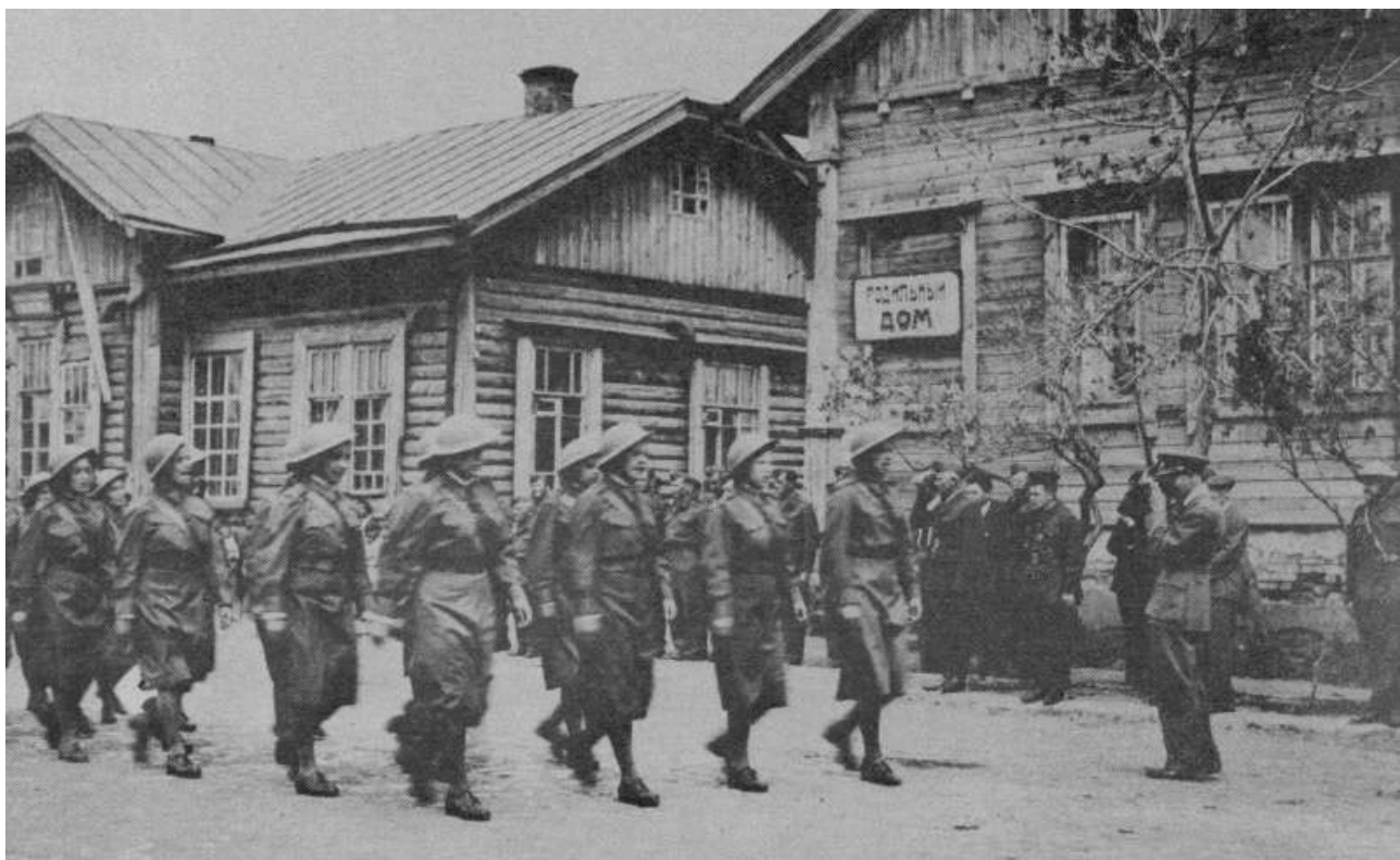
1-й ОЧПБ (м. Бузулук, лютий 1942 р.) [2, 165]