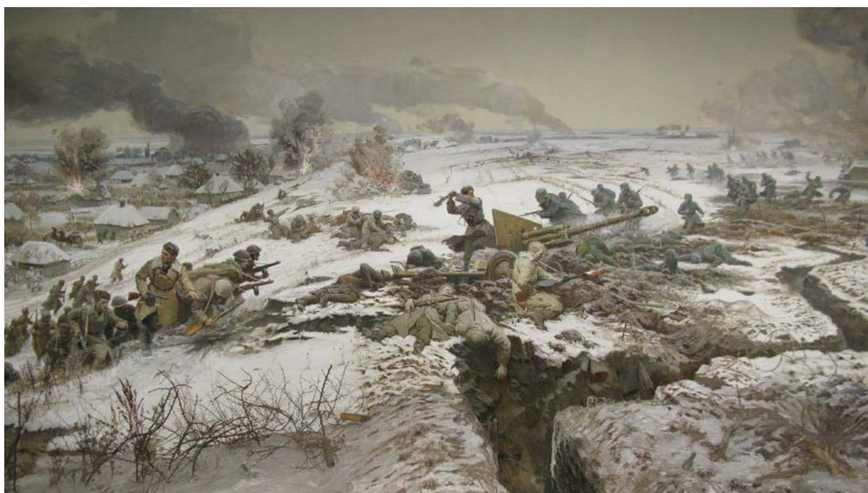
Діорама «Бій біля с. Соколове 8 березня 1943 року»: О. Ярош веде 1-шу роту 1-го ОЧПБ в атаку (з експозиції Зміївського краєзнавчого музею)