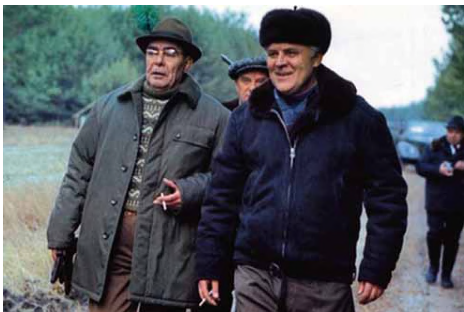
L. Breżniew i W. Szczerbykij podczas polowania pod Kijowem (1976 r.)