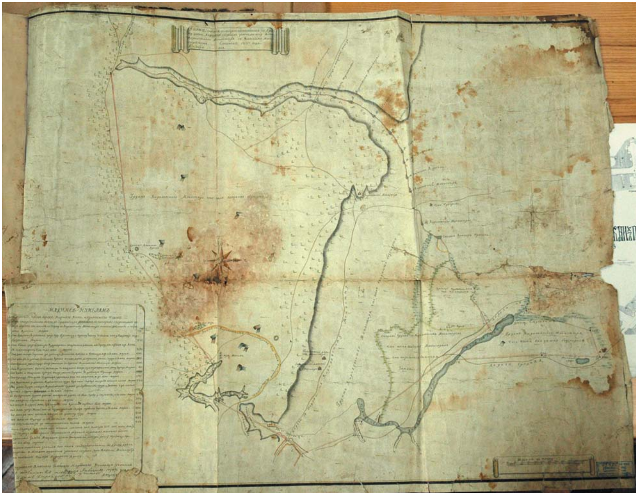
Мал. 3. Фрагмент оригіналу карти Києва 1752 р.