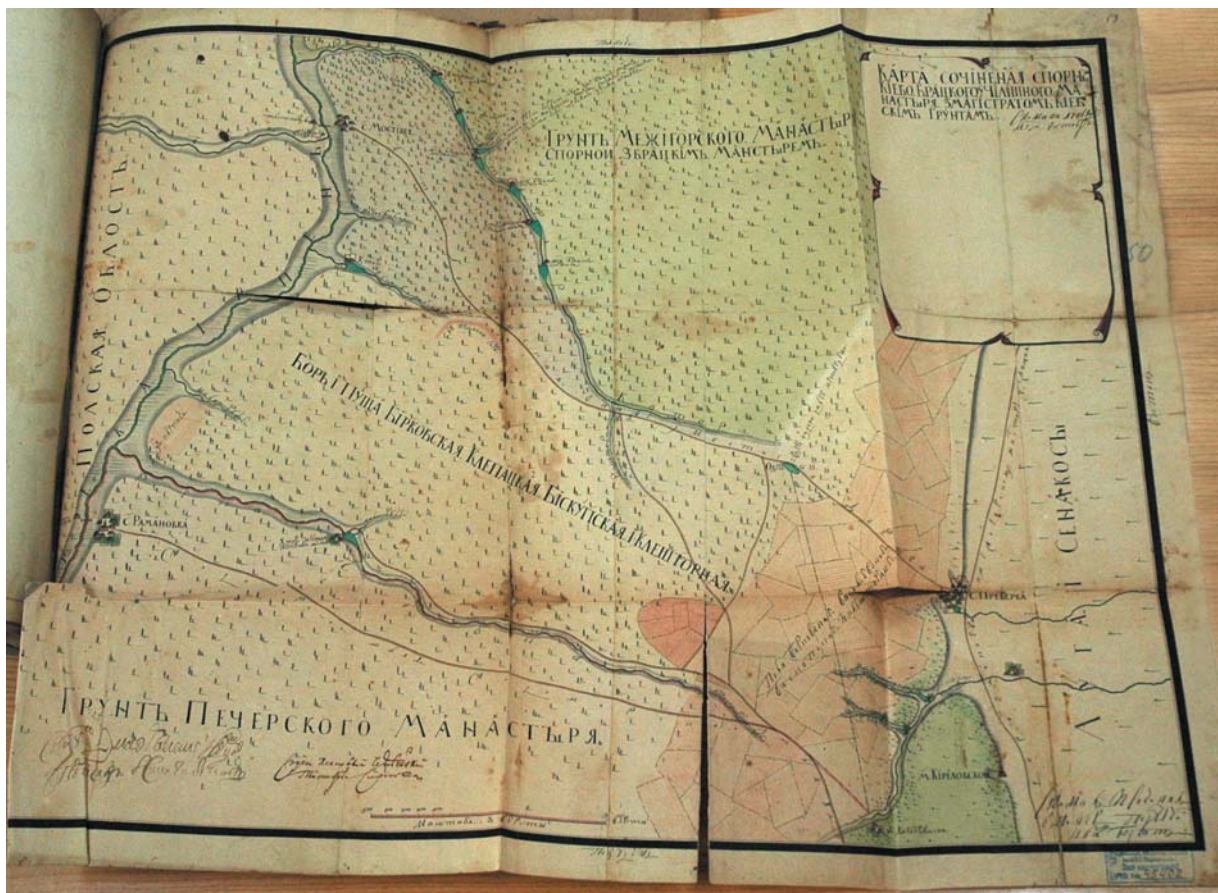
Мал. 1. Фрагмент оригіналу карти Києва 1746 р.

час його упорядкування. Перша з них має назву "Карта сочиненая спорным Киево-Брацкою училищного монастыря з магистратомъ киевскимъ грунтамъ" і датована 1746 р. (мал. 1 і 2). Друга під назвою "Карта снятая и свидѣтельствованная по дукту [тобто опису межі земельних володінь. – Д. В.] дяка Алферьева спорныхъ земель по иску Киево-Кирилловскаго монастыря съ Киевскимъ магистратомъ" – це копія, зроблена 1794 р. з оригіналу 1752 р. (мал. 3 і 4). Очевидно, карти цікавили упорядників альбому як картографічні свідчення про стан відповідної території в минулому. А виготовлені вони були як додатки до земельних судових спорів між київським магистратом і монастирями.