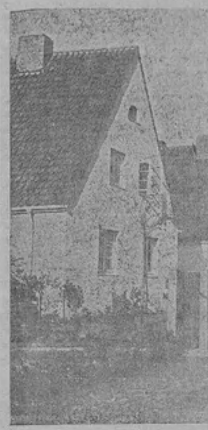
В таких хазах живуть тепер в новій столиці. На світанку село біля Франкфурта.

ну всього населення Німеччини. Треба було теж зміцнити в них свідомість їхнього незмінного права на землю, яку вони обробляли. Малось на увазі зробити в найкоротшому