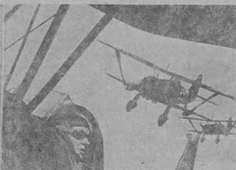
Війна на нове обличчя світу ведеться на суходолах і морях, і в повітрі. На світанні плачуче на обриві місто, до якого підходить німецькі танки. На другій світанні — бойові літаки в дії.