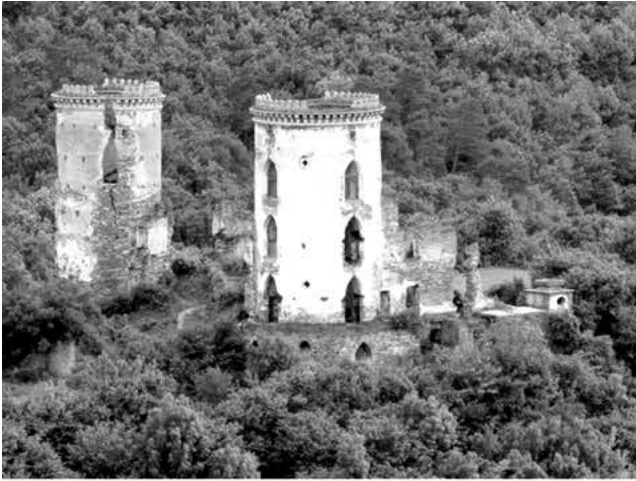
Рис. 1. Руїни Червоногородського замку.