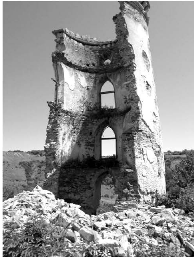
Рис. 4. Обвал вежі.