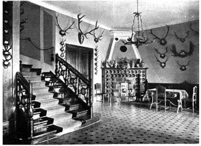
Рис. 3. Інтер'єр палацу.