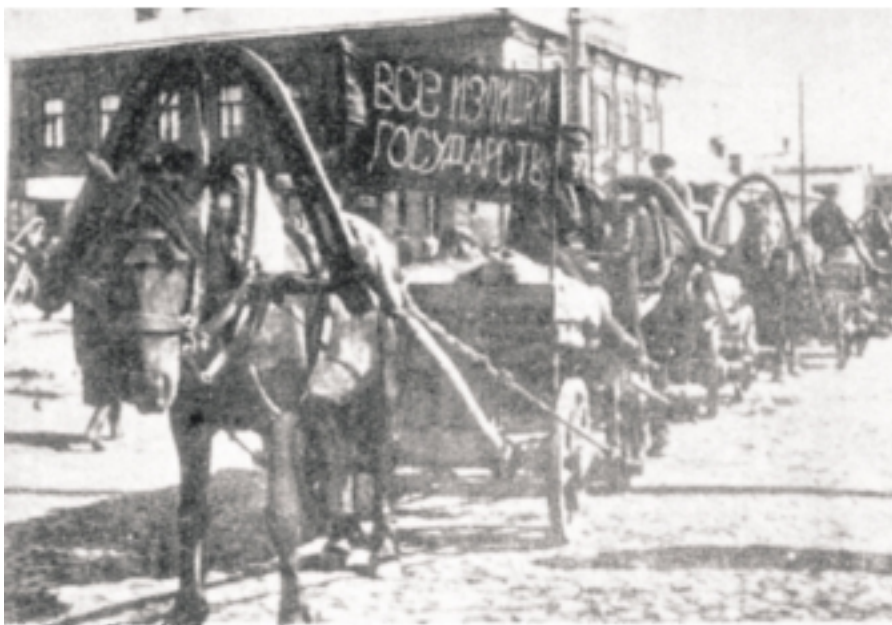
По-ударному выполним план хлебодачи. Красный обес с зерном.