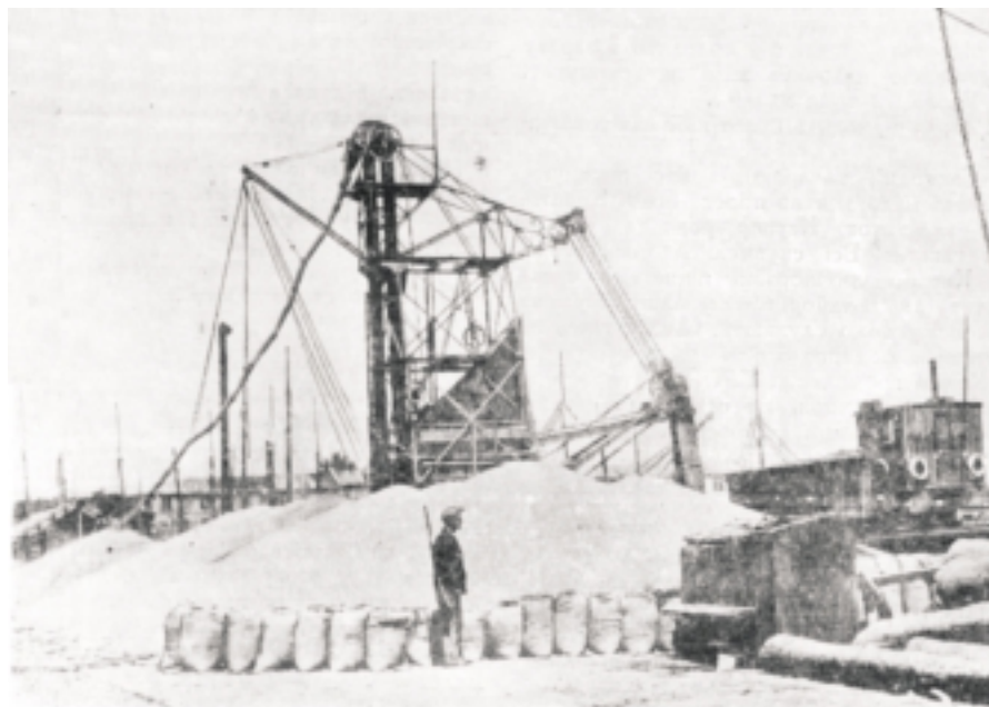
Зерно, що прибуло на баржі в Херсона в одеській порт, перевантажується плавучим елеватором в штабелі.