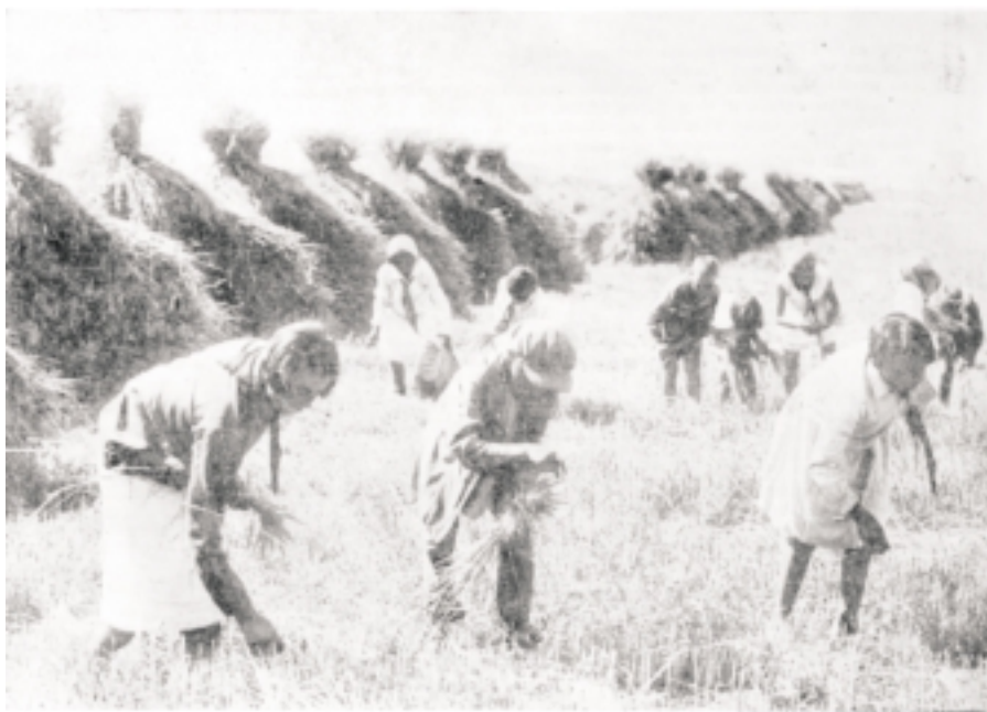
Пионеры собирают колосья (Крымский МТС, колхоз им. Ленина, Азово-Черноморский край)