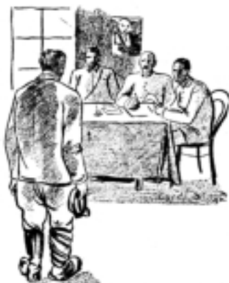
— Тоді Семенів, що знаходиться в середній земній кулі. Семенів (подумавши) — Хліб важко- ний мушкетер...