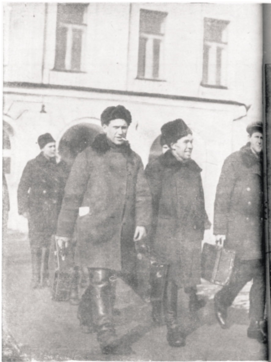
РЕШЕНИЕ ОБ ОРГАНИЗАЦИИ ПОЛИТОТДЕЛОВ ПРИ СОВХОЗАХ И МТС — одно из важнейших решений пленума объединенного пленума ЦК ВКП(б) и ЦКК. Политотделы при совхозах и МТС должны стать связующим звеном между партийной интеллигенцией в деревне, осуществляющей социалистическую реконструкцию сельского хозяйства и социалистическое образование колхозных масс. На снимке: группа молодых коммунистов, выделенных на работу в политотделах при совхозах и МТС, перед отъездом на место работы.