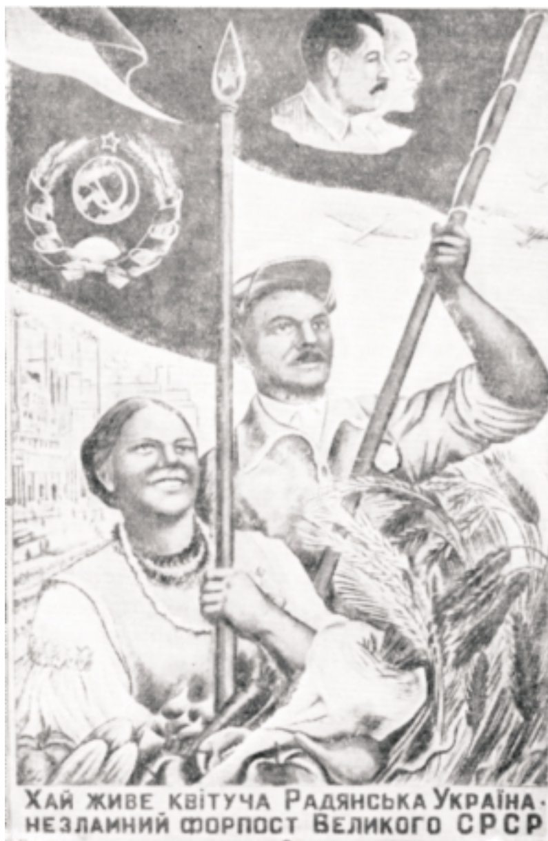
Плакат роботи худ. Г. Довженко