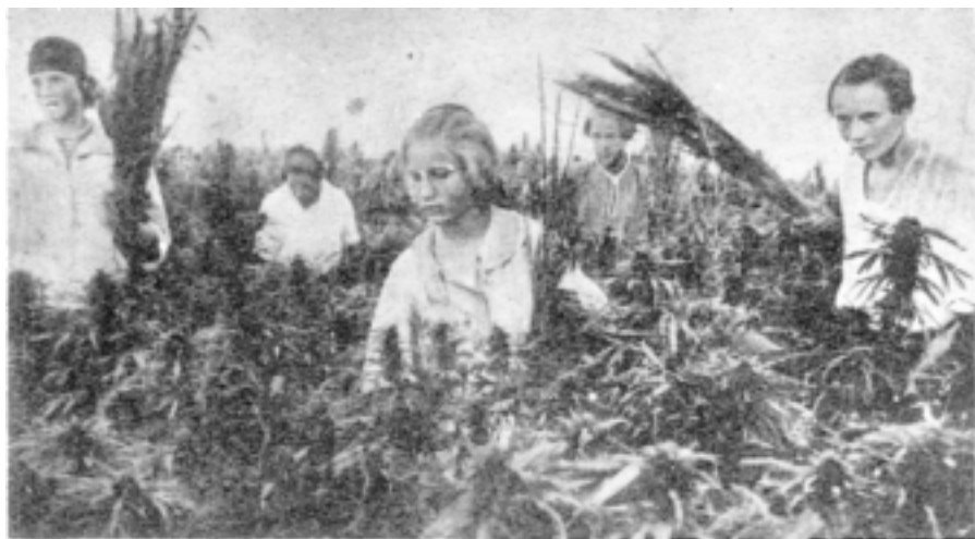
О флота уборочной. Уборка конопля в коммуне им. Косовара Драбонского р-на, Киевской области