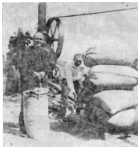
Здують державні хліб.—Колгосп ім. Сталіна