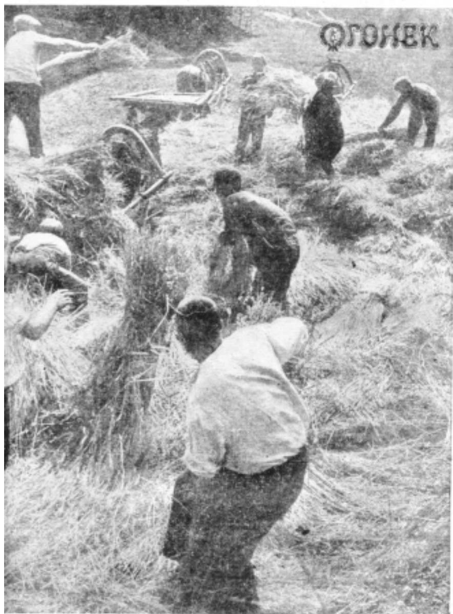
ПОЛНОСТЬЮ И В СРОК СДАДИМ ХЛЕБ ГОСУДАРСТВУ