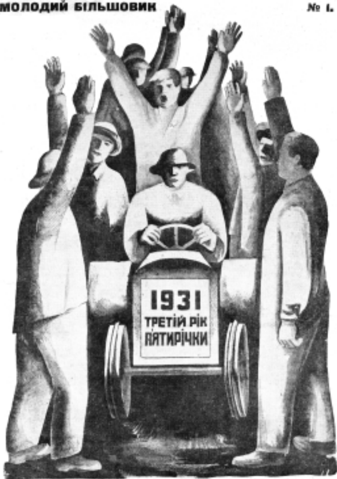
Рис. зр. Кооперативна та Соцзнак.