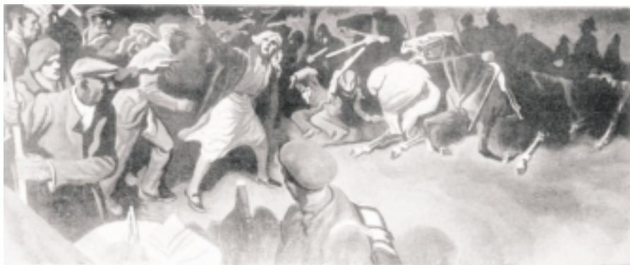
Білий, Голодні війна.

Твори західних художників — з ілюстрацій до ст. Б. Терновця «Революційне мистецтво в боротьбі проти війни й фашизму» (Малярство і скульптура.— 1936.— № 8).