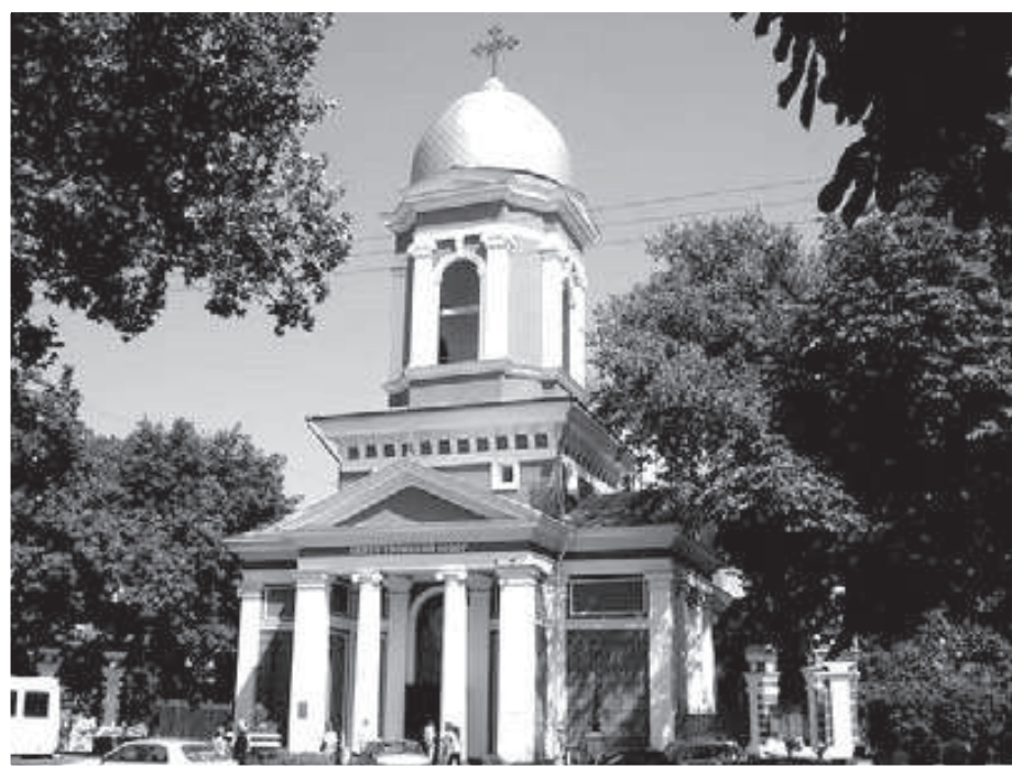
Грецька Троїцька церква, м. Одеса (фото 2007 року)

Існуюча думка про те, що Одеса була «грецьким містом», є невірною і заснованою, швидше за все, на тому, що греки склали значну частину іноземного купецтва. До 1807 р. була зведена Одеська Грецька церква Святої Трійці, будівництво якої почалося після закладення фундаменту у 1795 р. Фінансування в розмірі 2 тис. руб. надійшло зі скарбниці за наказом імператриці, також був організований збір пожертвувань одеських греків.