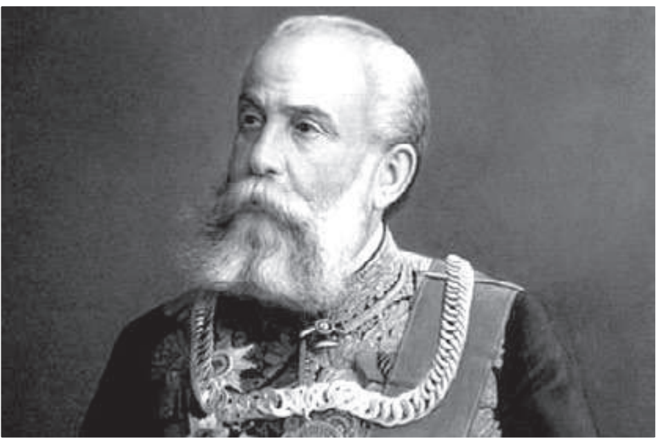
Григорій Григорович Маразлі – відомий меценат і філантроп грецького походження

Його благодійні діяння неможливо описати декількома рядками. Вражає один лише перелік зведених на кошти Г.Г. Маразлі або