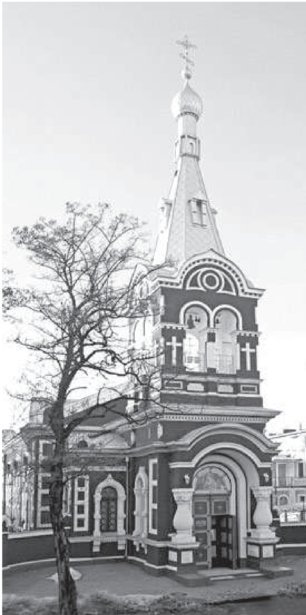
Храм Григорія Богослова і святої мучениці Зої, побудований коштом Г.Г. Маразлі (вул. Старопортофранківська м. Одеси)

куплених і подарованих ним місту будівель: Художній музей, Міська бібліотека і Музей Одеського товариства історії та старожитностей (сучасний археологічний музей), Народна читальня, бактеріологічна станція, церква Григорія Богослова і мучениці Зої, церква на Куяльницькому лимані тощо.