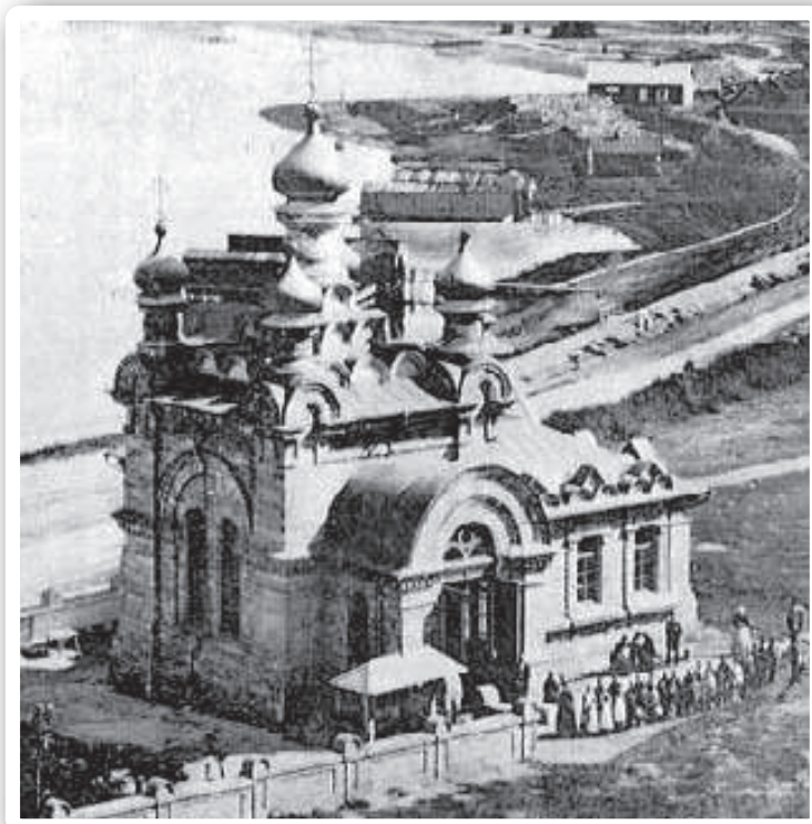
Пантелеймонівська церква (поч. ХХ ст.), зведена коштом Г.Г. Маразлі

Будівля Міської публічної бібліотеки, згодом Музею Одеського товариства історії та старожитностей, а зараз – Одеського археологічного музею НАН України, побудована коштом Г.Г. Маразлі