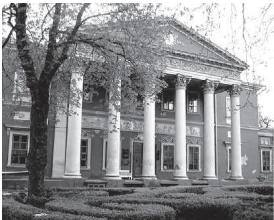
Будівля Одеського художнього музею, придбана Г.Г. Маразлі у подарунок місту (вул. Софіївська м. Одеси)

гатьох міст Російської імперії – духовні особи, городяни, військові Волинської, Курської, Нижньогородської, Тобольської, Пензенської та інших губерній. З метою правильного розподілу коштів, що надходили, восени 1821 р. були створені Одеська і Кишинівська грецькі допоміжні комісії . Одеська комісія складалася з 9 чоловік під голову-