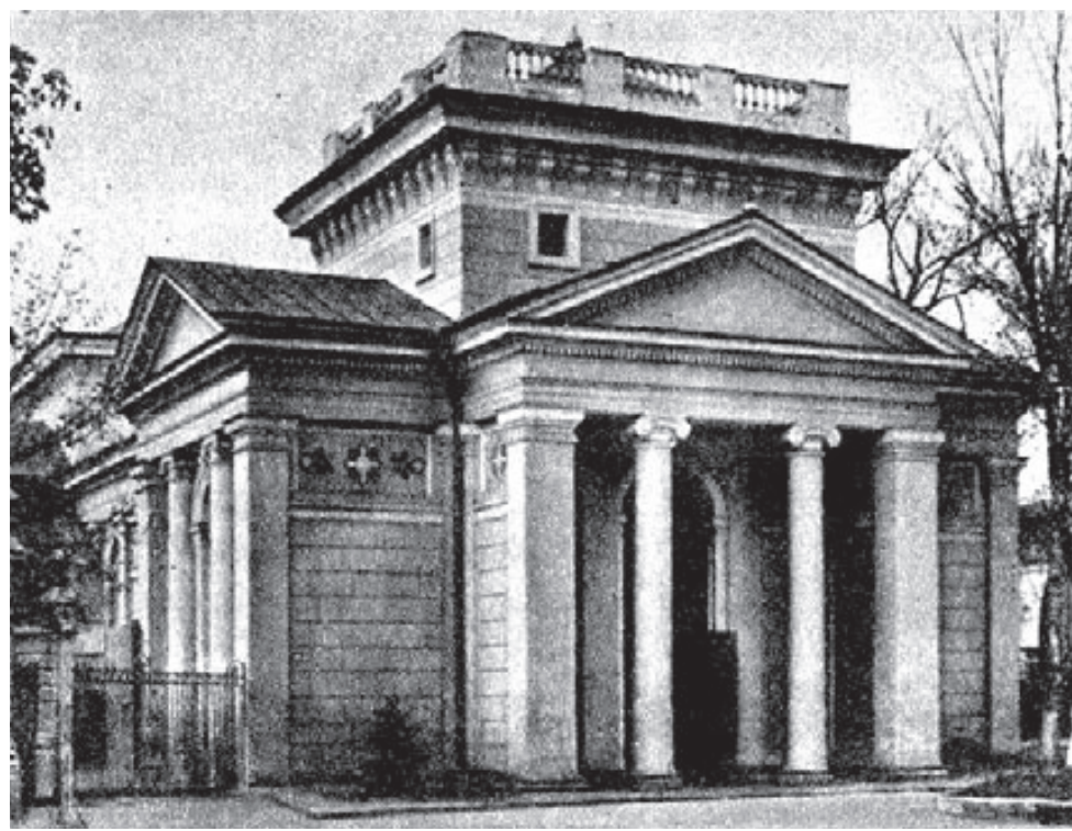
Грецька церква Св. Трійці, м. Одеса (фото орієнтовно п. 1980-х рр).

Царський уряд також задовольнив прохання переселенців, указом від 20-го травня (3 червня) 1797 р., дозволивши іноземцям взагалі зарахуватися за бажанням до стану купців або міщан і заснувати магістрат, з появою якого була скасована «комісія для греків і албанців». Магістрат для іноземців проіснував до 1801 р., коли указом Олександра I був закритий.