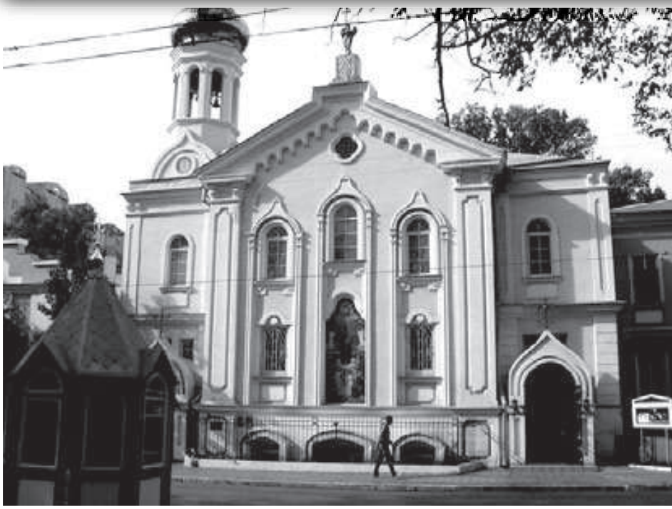
Одеська Стурдзівська богадільня жалісливих сестер (побуд. 1848-1853 рр.), вул. Белінського м. Одеси