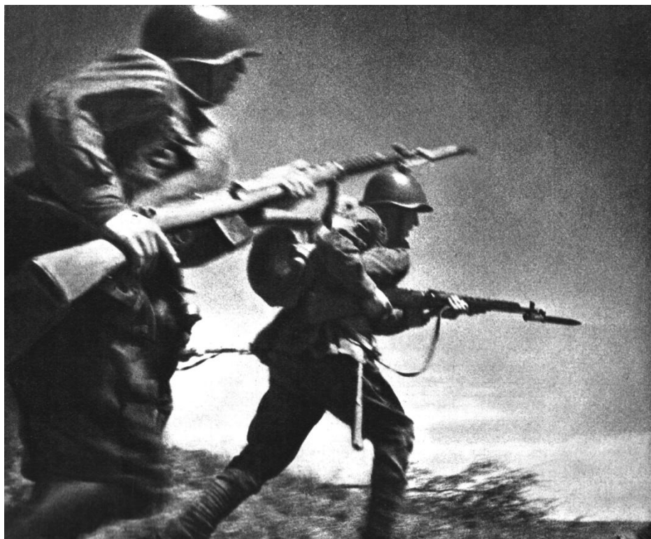
Рис. 5. Світлина М. Альперта “В атаку!”

У книзі опубліковано шість кращих світлин воєнного часу, а першою стоїть “В атаку!”. Ця світлина подається нижче.