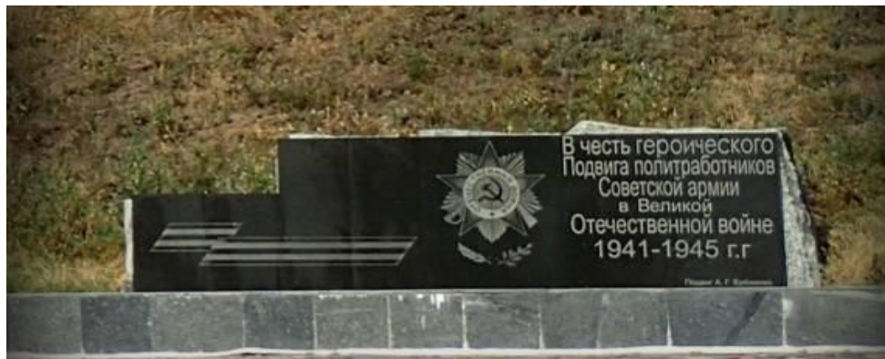
Рис. 4. Гранітна стела у підніжжя Меморіалу

Біля підніжжя Меморіалу стоїть гранітна стела, на якій викарбувані слова: “В честь героического подвига политработников Советской Армии в Великой Отечественной войне 1941-1945 гг.”. А нижче, дрібнішими літерами: “Подвиг А.Г. Еременко”.