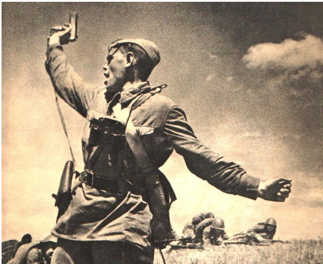
Рис. 1. Світлина Макса Альперта “Комбат”

Мова у ній йтиме про подію, зафіксовану у загальновідомій світлині радянського фотокореспондента Макса Альперта під назвою “Комбат”. Вона була розтиражована мільйонами примірників в різноманітних вітчизняних і зарубіжних виданнях. На фотографії зображений командир з пістолетом у руці, піднятою над головою, який в момент високого духовного пориву піднімає бійців в атаку.