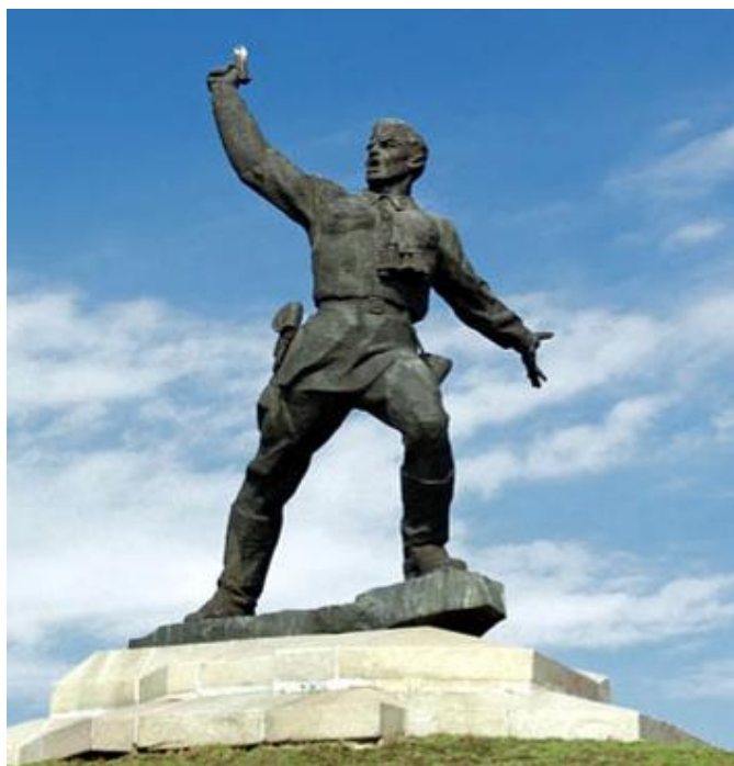
Рис. 3. Меморіал “Пам’ятник подвигу політработників”

Луганська область – друга в Україні, де добре знають Олексія Єрьоменка. Через п’ять років після появи в Запоріжжі горельєфа “Комбат”, 7 травня 1980 р. біля траси Луганськ –