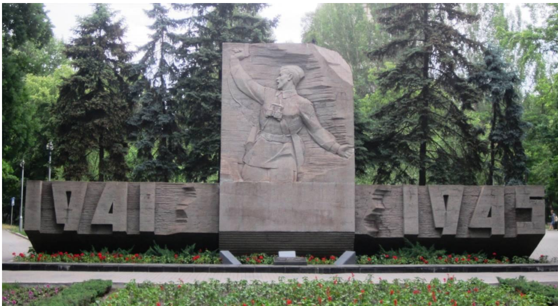
Рис. 2. Горельєф “Комбат”

Алея Слави – добре відоме всім жителям, зразково упорядковане місце. Тут ростуть дубки, посаджені Героями Радянського Союзу, а з ранньої весни до пізньої осені – квітнуть квіти.