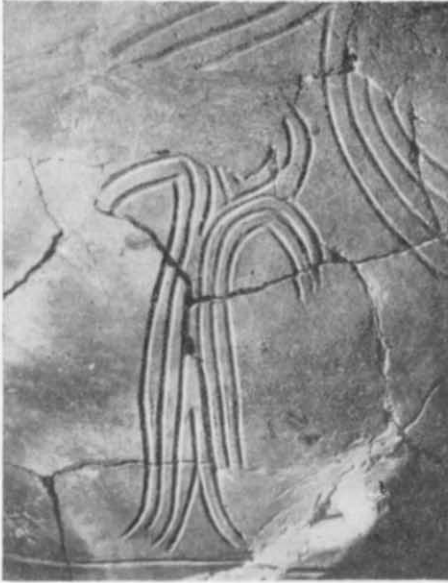
Рис. 3. Перше антропоморфне зображення.

Живописні і графічні антропоморфні зображення — рідкісне явище в сфері культури Кукутені — Трипілля 3 . Серед пам'яток трипільської культури Середнього Подніпров'я, крім гребенівських, відомі три