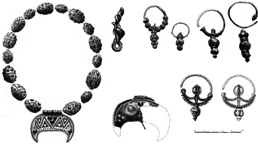
Рис. 2. Оздобы із скарбу початку X ст. із с. Доросині. Худ. В. Мискевич

Згадані скарби першої половини X ст. належать до третьої хвилі напливу арабського срібла до Східної і Центральної Європи. Тим самим часом (900–940 рр.) датуються й скарби з околиць давнього Галича (скарб 1947 р. із с. Крилоса, який містив 1000 диргемів, розпорошений скарб 1967 р. із с. Нижнів).