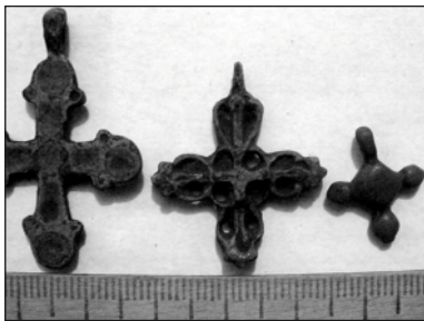
Рис. 1. Хрестики часів Київської Русі, знайдені на місці літописного Здвиженська протягом 2013-2015 рр.