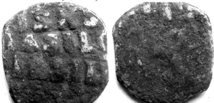
Рис. 2. Візантійська монета «фоліс», знайдена на місці літописного Здвиженська 2014 року

писну річку. Це було типове острівне (мисове) поселення, яке займало площу близько 20 га. Отже, місто було велике, понад 15-20 великих будинків з прибудовами, сараями, конюшнями. Виходячи з висновків П. Толочка відносно густоти населення міст Київської Русі, згідно з якими на 1 га проживало в середньому 125 людей, отримуємо, що населення давнього Здвиженська становило щонайменше 2500 осіб [24, с.54-57].