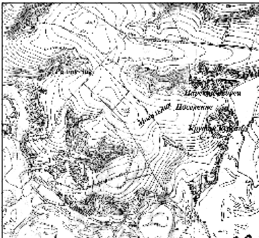
Рис. 1. Гочевский археологический комплекс (летописный Римов)

Гочевский археологический комплекс расположен в 0,5 км к северо-западу от с.Гочево Беловского района Курской области, на правобережной террасе р.Псел.