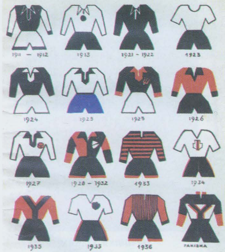
Однострой С. Т. «Україна» 1911—1936

Емблема. У сучасній українській історіографії утвердилася хибна думка про те, що емблемою товариства є зображення грецького юнака з щитом та здійнятим над