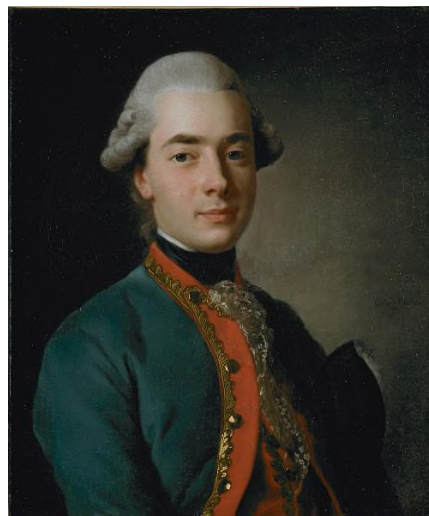
Портрет Андрія Розумовського. Художник А. Рослін, 1776р.

Важливою складовою заходу стала презентація онлайн-виставки «Спадок Андрія Розумовського в архівах Європи», на якій вперше були представлені унікальні експонати із зібрань провідних наукових та культурно-освітніх європейських інституцій, зокрема з: ської національної бібліотеки, Архіву Товариства друзів музики у Відні, Британського та Віденського музеїв.