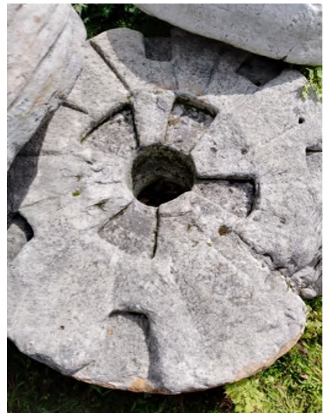
Жорно батуринського водяного млина, XVII ст. Фото 2022 р.

двір» заповідника «Гетьманська столиця». Воно є свідком минувшини, доказом працьовитості й жертовності наших пращурів, символом незнищенності українського народу, оберегом, який нагадує нам чіі ми нащадки й якою ціною нам дісталась наша земля та незалежність.