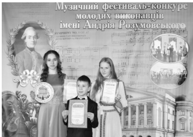
VI Обласний музичний фестиваль-конкурс молодих виконавців імені Андрія Розумовського (22 жовтня 2017 р.).

своїми виступами підкреслюють його значимість та підтримуть своїм натхненням конкурсантів. Так, ці пройдені роки учасники, організатори, журі та гості фестивалю мали нагоду прослухати виступи оркестру «Батуринська скарбниця», основу якого складають артисти Національної опери ім. Т.Г. Шевченка, дует «Два роялі» в складі Олени Антоненко та Людмили Скриннік,