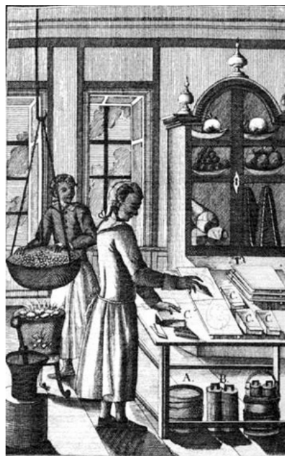
Ілюстрація до книги «Всеобщее и полное домоводство» В. Левшина, 1795 р.

Отже, виявляється, що окрім творів світових композиторів, античних поетів та європейських класиків гетьман цікавився ще й веденням домогосподарства і це найкраще розкриває постать Кирила Розумовського із нової, незвичної сторони. Тому вивчення бібліотеки гетьмана має продовжуватися та руйнувати давні стереотипи.