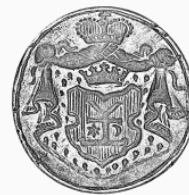
Печатка гетьмана Івана Мазепи із зображенням його князівського герба, початок XVIII ст. Із колекції Музею Шереметьєвих