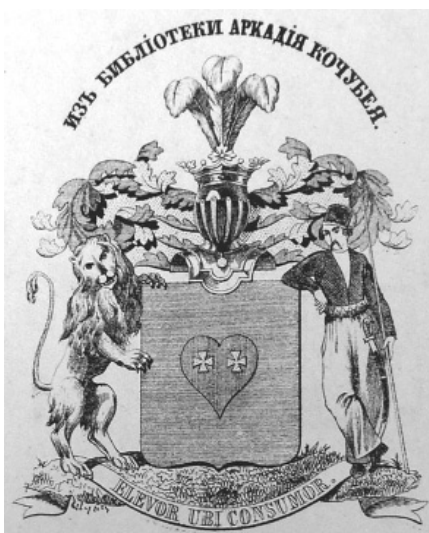
Екслібрис Аркадія Васильовича Кочубея. Перша половина XIX ст.