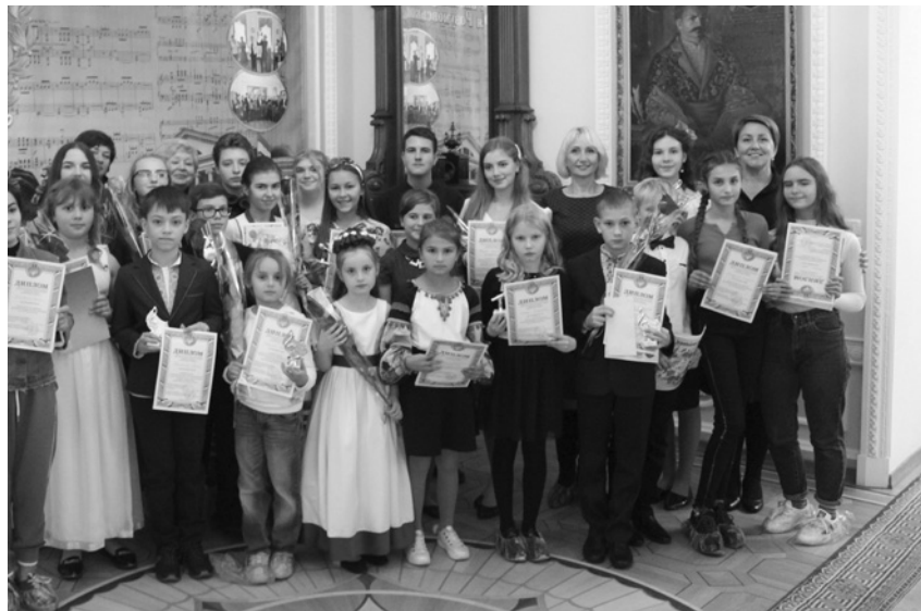
VIII Обласний музичний фестиваль-конкурс молодих виконавців імені Андрія Розумовського (22 жовтня 2019 р.).

Аналізуючи пройдений шлях, розуміємо, що це була надзвичайно правиль-