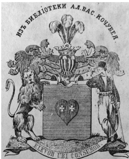
Екслібрис Олександра Васильовича Кочубея. Перша половина XIX ст.