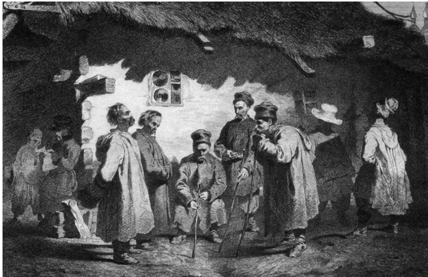
Судна рада. Тарас Шевченко, 1844 р.

Аналізуючи вищеописану судову справу можемо зробити висновок, що сільська громада у XVII ст. брала безпосередню участь у розслідуванні злочину, скоєного одним з її членів. Громада мала право проводити допит звинуваченого, а зібрані нею докази судом вищої інстанції визнавалися цілком законними і приймалися до уваги при винесенні вироку.