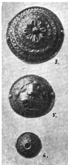
Світл. 2, 4, 3, 5, 6 — фалари.