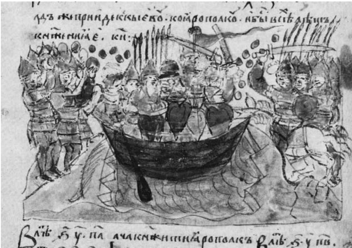
Рис. 1. Мініатюра з Радзивилівського літопису

Але чи існують інші джерела, що сприяли б гармонізації співвідношення вже традиційних матеріальних та писемних джерел у відтворенні цільної картини події що досліджується?