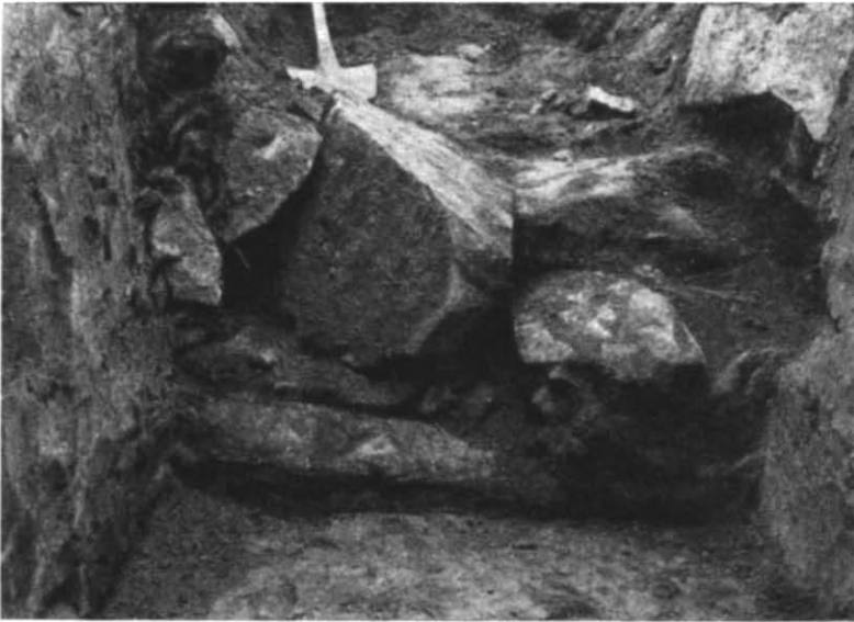
Рис. 4. Бутова кладка східної частини фундаменту брами у теплофікаційній траншеї 1940 р.

Ширина виявленої на тротуарі кладки фундаменту дорівнює 2,3 м. Кладка залягає на глибині 2 м від сучасної поверхні. На відстані 6 м від цієї кладки у траншеї, прокладеній поперек вулиці, зустрілася друга подібна бутова кладка, теж складена з каменів пісковика. Вона почи-