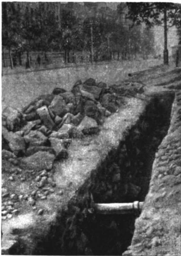
Рис. 2. Фундамент брами, перерізаний траншеєю водопроводу у поздовжньому напрямку (1935 р.).

Тоді ж виявилось, що ширина проїзду на кінцях (південному і північному), тобто на місці в'їзду і виїзду, становить лише 3,7 м, оскільки на кінцях кладка фундаментів розширюється до середини у східній частині на 1 м, а в західній — на 1,3 м, відповідно звужуючи на 2,3 м