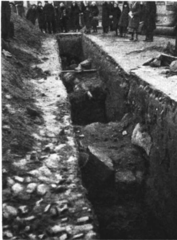
Рис. 3. Фундамент брами, перерізаний теплофікаційною траншеєю у поперечному напрямку (1940 р.).

№ 11, де тротуар підходить до заасфальтованої мостової, на глибині 0,32 м від рівня сучасної поверхні була виявлена цегляна кладка на розчині сірого кольору з білими крапочками, звичайному для XVII—XVIII ст., що вказує на реставрацію брами протягом довгого часу її існування. На глибині 0,77 м від сучасної поверхні починалась бутова кладка, яка сягала 1,23 м і лежала in situ на лесі. Камені у кладці були з пісковику сірого кольору 5 , різної форми і різного розміру, не