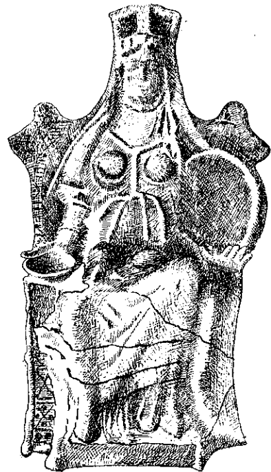
Рис. 2. Теракотове зображення Кібели.