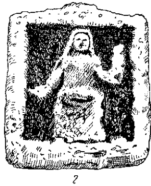
Рис. 4. Зображення Кібели з мармуру (1) та вапняку (2).