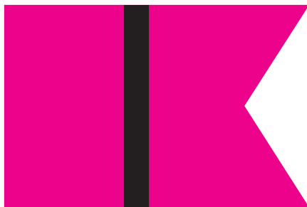
Кулеметна команда 12-го куреня