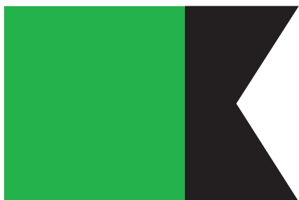
1-ша чота Окремої технічної сотні

До наказу долучені два чорно-білі малюнки. Один – представляє значок 1-ї сотні 10-го куреня, другий – кулеметної команди 12-го куреня. Обидва значки на них мають форму прямокутника з вирізом у вигляді „ластівчиного хвоста” з правого боку. Перший значок – білий з вертикальним червоним паском посередині (очевидно, кількість пасків відповідала номеру сотні в курені або чоти в технічній сотні), другий – розділений вертикально на дві частини, з яких ліва ширша (приблизно \frac{2}{3} ширини значка) має зелений колір, а права вужча – чорний. Однак малюнки, як і сам наказ, не дають повної інформації про лінійні („напрямкові”) значки в 4-й стрілецькій бригаді, зокрема, бракує розмірів самих значків і окремих елементів їх. У зв’язку з цим подані тут наші графічні реконструкції, не претендуючи на абсолютну точність, відтворюють лише їхній загальний вигляд.