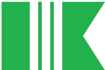
3-тя сотня 12-го куреня