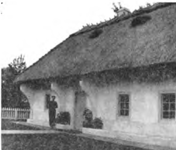
“Українська хата” в Елк Айленд Парку

будови, бо наші майстри не мали відваги братися до цієї роботи зо страху, що не догодять урядові.