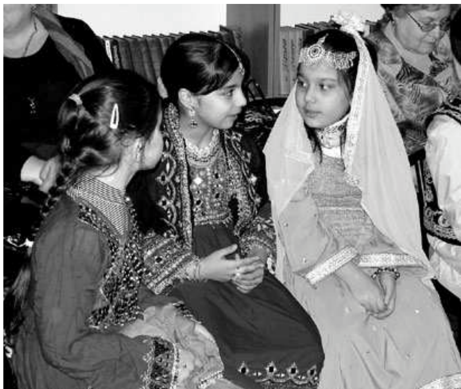
Відзначення Дня рідної мови учнями національних шкіл недільного типу

Урядом Респу-бліки Болгарія під час карантину у листопаді 2009 року за ініціативи Асоціації болгар України було надано допомогу ліками та медичною апаратурою жителям півдня Одеської області , де компактно проживають представники болгарського етносу, на суму 150 тис. євро. Посольство Чеської Республіки підтримує про-