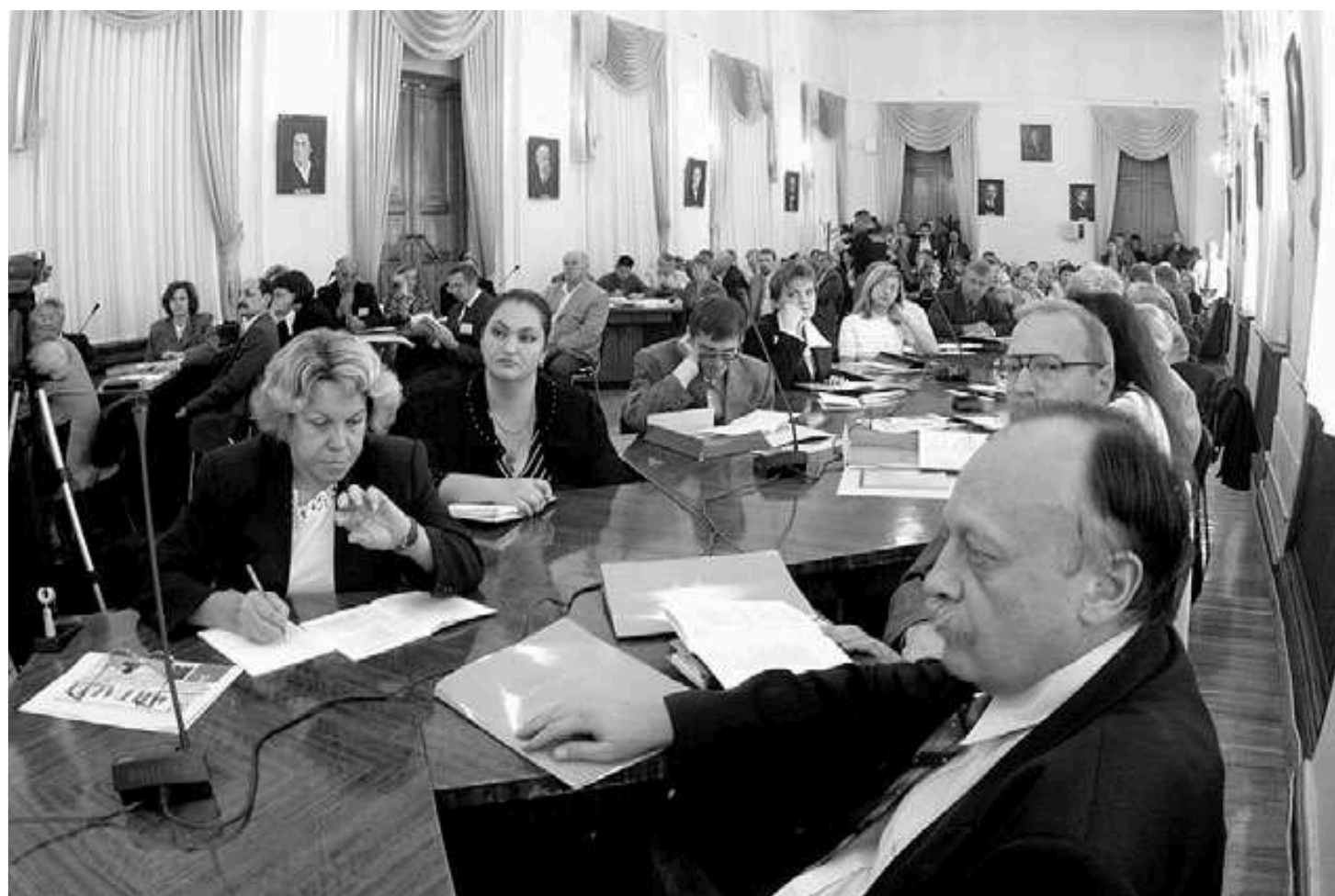
Під час проведення міжнародної науково-практичної конференції «Історія німців Причорномор'я та українсько-німецькі культурні зв'язки» в м.Одесі

Вся ця діяльність формує особливий морально-психологічний клімат толерантності, що дозволяє не просто співіснувати представникам різних національностей, а плідно, конструктивно взаємодіяти, створювати спільне життя, сприяти сталому розвитку регіону.