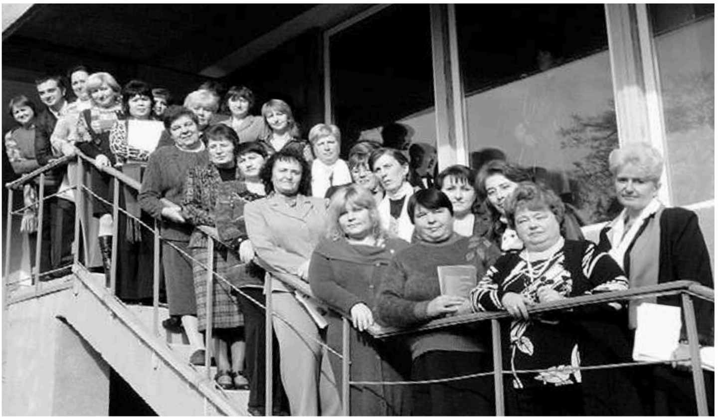
Учасники семінару для вчителів російської мови та літератури, проведеного за ініціативи товариства «Русич»

плідне співробітництво органів виконавчої влади, місцевого самоврядування та громадських організацій національних меншин. Ми прагнемо того, щоб наявний плюралізм культур завдяки встановленню діалогу між ними і надалі залишався нашим спільним багатством.