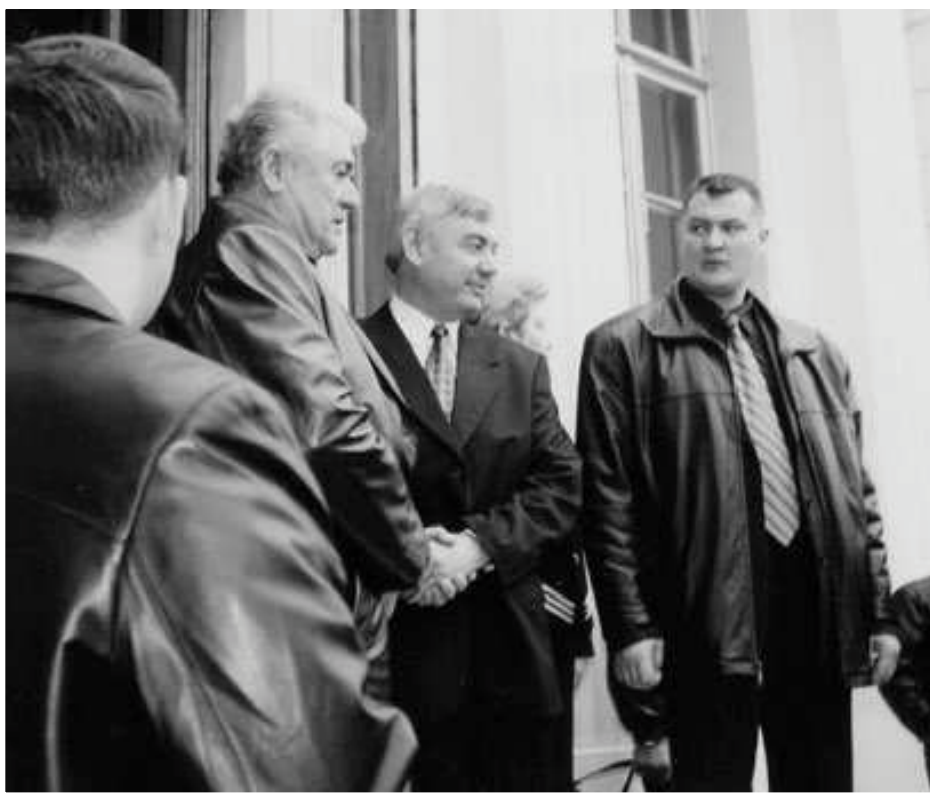
Під час зустрічі Президента Республіки Молдова Вороніна з молдавською громадськістю в рамках візиту до Одещини

Не менш трагічні наслідки для поліетнічного складу Одещини мала Друга світова війна , яка забрала мільйони життів і під час якої відбувався цинічний геноцид євреїв та циган, винищувались представники інших національностей.