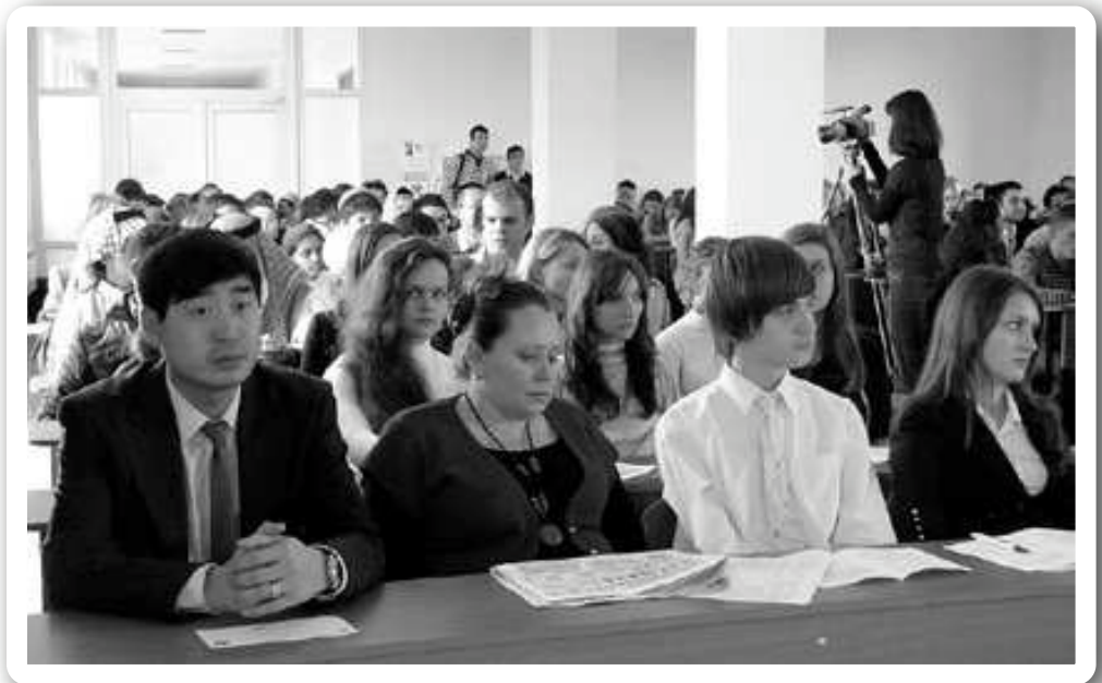
Під час церемонії відкриття IV Регіонального фестивалю «Райдуга мов»

Для держав, переважна більшість яких є поліетнічними, набуває надзвичайної ваги проблема пошуку і впровадження механізмів, які б дозволили досягти необхідного балансу між стабільністю суспільства, що вимагає певної уніфікації, та, одночасно, збереження його поліетнічності та полікультурності.