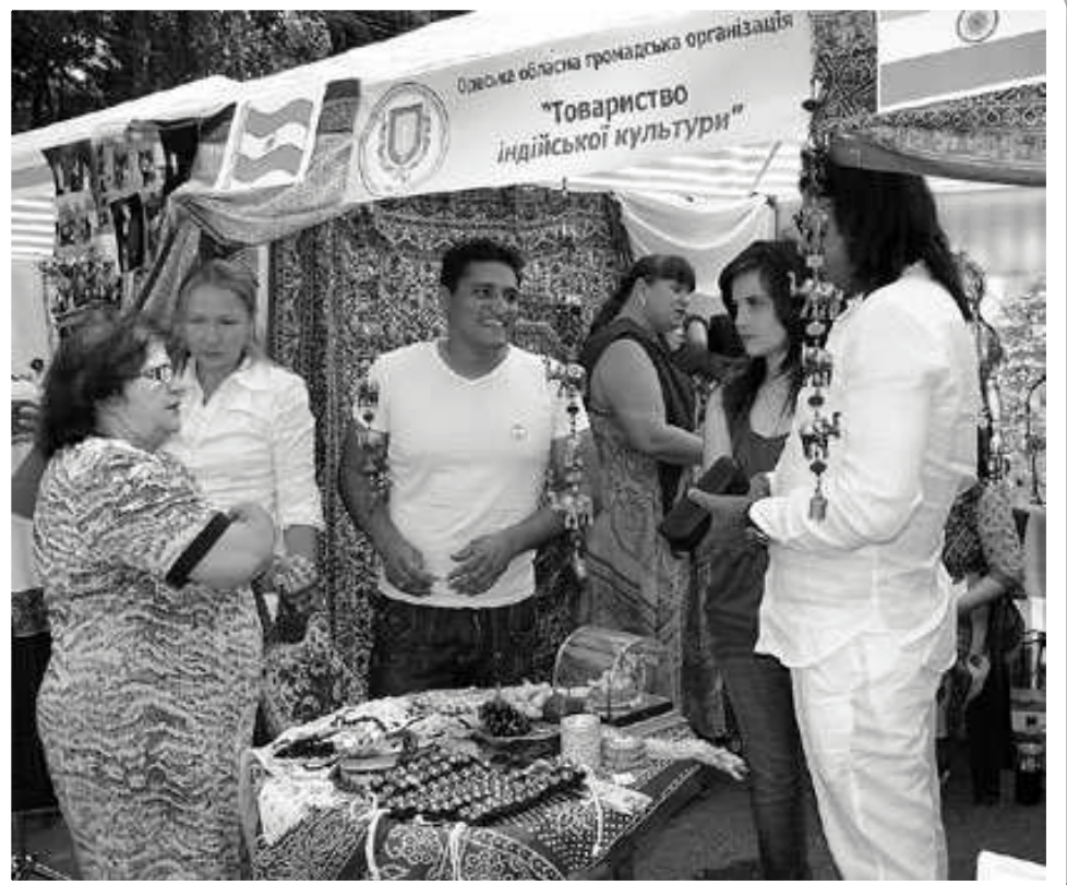
Члени обласної громадської організації «Товариство індійської культури» сприяють поширенню інформації про історичну батьківщину

Протягом другої половини XIX – початку XX ст. уряд з одного боку почав здійснювати заходи з уніфікації соціально-економічного становища представників різних національностей, з іншого – формував різні культурно-освітні умови для окремих груп. Так, на початку XX століття українці, поляки, євреї, на відміну від болгар і німців, були позбавлені можливості розвивати власну культуру і навіть переслідувались за це. Загострились проблеми антисемітизму, що мало трагічні результати, особливо у містах краю. Ситуація дещо поліпшилася після 1905 року в зв'язку з загальною демократизацією у суспільстві. В цей період Одеса стає центром національно-визвольної боротьби греків, болгар, сербів, поляків.