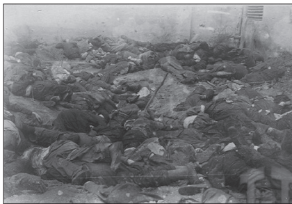
Внутрішній двір в'язниці «Бригідки», червень 1941 р.

ді різняться в окремих деталях). Обґрунтування факту побиття євреїв під час ескортування до в'язниць у подібний спосіб не є виправданим та навряд чи має щось спільне з об'єктивним та глибоким дослідженням суті проблеми.