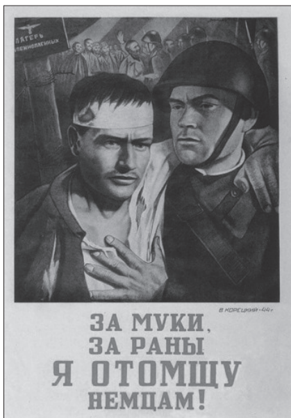
Радянський агітаційний плакат, 1944 р.

строї і що вона була гідна того, аби їй довірили утворення Української держави» 272 , та що ОУН(б), координуючи свої військові дії з німцями, могла у принципі координувати їх і щодо єврейських погромів та страт 273 . Однак, крім того, що існування проблем із такою «координацією» визнає і сам дослідник 274 , гіпотеза автора щодо необхідності отримання ОУН(б) з боку німців якогось «мандата довіри» для «утворення Української держави» спростовується документальними джерелами: постановою II ВЗ ОУН(б), де наголошується на вповні суверенну Українську державу, за яку бореться ОУН(б)