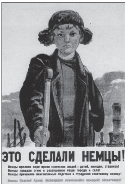
Радянський агітаційний плакат, 1943 р.

тогочасного українського населення ЗУЗ було без додаткових пояснень зрозуміло, які саме «жидова, мадяри» та які саме «Москва, Польща» («жидокомісари, жидокомуні, жидобольшевики» тощо) малися на увазі у відозві. Так само сучасним мешканцям України, наприклад, зрозумілий термін «донецькі», а прорадянськи налаштованим мешканцям СРСР у 1941—1945 рр. — радянські заклики «убити німця» у плакатах, віршах 268 , статтях 269 , офіційній пресі тощо, а також згадка про злочини «німців» у преамбулі указу про створення Надзвичайної державної комісії 270 .