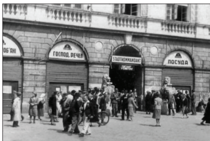
Будівля Львівської ратуші в часи німецької окупації, 1941 р.

Детальніше про події у Львові було відзнято 30 червня (у тому числі і сцену арешту), і тому невідомо, яким чином він стосувався «погромних заходів», адже, за Химкою, погром мав місце виключно 1 липня. Крім того, якщо уважно передивитись цю кінохроніку 94 , неможливо не помітити, що згадуваний Химкою «арешт на вулиці Коперника» — це епізод, де якісь люди штовхають крізь натовп кількох чоловіків і передають їх німецьким військовим, які заводять їх в арку будівлі з двома левами обабіч та написом «Посуд» праворуч. Усе це супроводжується звуковим рядом: «ганебні єврейські вбивці, які тісно співпрацювали з ГПУ, передаються обуреною юрбою німецьким військам на покарання». Однак ні камера, ні звуковий ряд не демонструють жодного «українського міліціонера» та не фіксують жодних ознак, за якими людей у кадрі можна було б ідентифікувати саме як міліціонерів. Єдиною особою в кадрі, яку можна визначити точно, є німецький солдат у касці. Що стосується конкретного місця подій, показаних на відео, то його добре ілюструє наведена вище фотографія, зроблена під час німецької окупації, хоча й пізніше, ніж вказаний випуск «Die Deutsche Wochenschau».