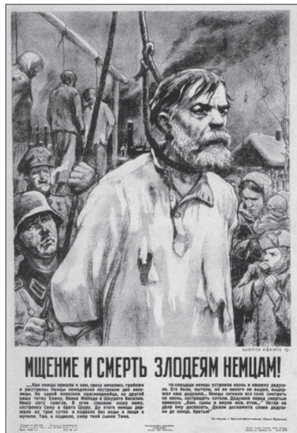
Радянський агітаційний плакат, 1942 р.