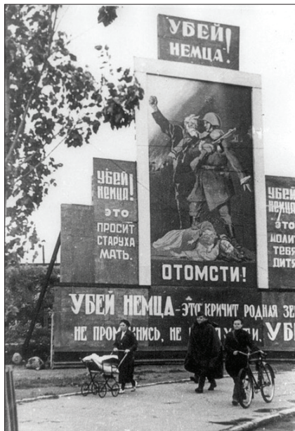
Радянські агітаційні плакати на вулицях Ленінграда, 1943 р.

Цитуючи другу відозву Климova з переліком ворогів: «Москва, Польща, мадяри, жидова» 264 , Химка знову забуває вказати, що ця теза у відозві йде у чіткій прив'язці до попереднього основного заклику ставати до боротьби за відстоювання у боях Української держави у лавах УНРА та ОУН, творення війська та міліції та обійняття усіх галузей господарства та суспільного життя під проводом ОУН 265 . Звичайно, що у тексті відозви немає прямих посилок на програмні документи ОУН(б), однак і автору відозви, і керівникам ОУН(б) та УНРА (членам ОУН(б)) 266 зміст цих документів був відомий, і вони мали забезпечувати діяльність підпорядкованих їм структур та відділів саме відповідно до їхніх вимог 267 . Крім того, для членів бандерівського крила ОУН та для більшості