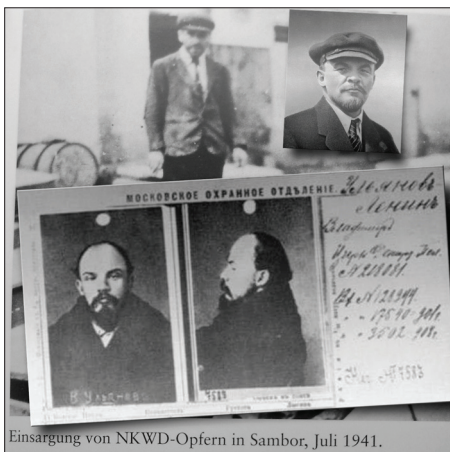
Einsargung von NKWD-Opfern in Sambor, Juli 1941.

Дуже мало місця у роботі відведено дослідженню ролі юрбишумовиння у погромі 1 липня 351 , однак навіть ту він переважно розглядає через призму «провідної ролі» у погромі української