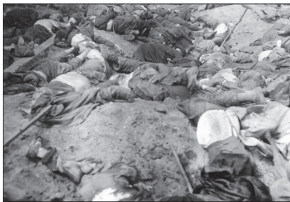
Внутрішній двір в'язниці «Бригідки», червень 1941 р.

Оскільки остаточно енкаведистська служба тюрми «Бригідки» втекла у ніч із 27 на 28 червня, останні уцілілі в'язні вийшли на волю з допомогою українських націоналістів та місцевих мешканців 28 червня 107 , бійці радянських військових підрозділів та співробітники НКВД залишили місто у ніч з 29 на 30 червня, а перші німецькі загони та батальйон «Нахтігаль» увійшли до Львова уранці 30 червня, то остання дата фактично і є єдиним днем червня, коли відповідні фотографії могли бути зроблені. Тому датування цих світлин в архівах музею «Територія Терору» та «Яд Вашем» збігається з тим, яке вказано Химкою щодо світлини з архіву