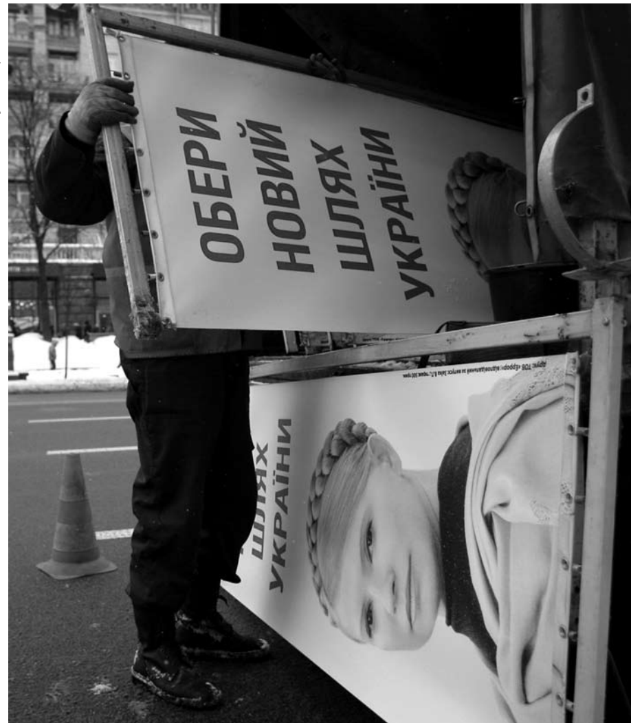
Демонтаж передвиборної агітації

У цьому сенсі Янукович не просто совок, а й рагуль, провінційний лох, який випадково потрапив на царський трон і не відає до пуття, що з тим скіпетром та іншим причандаллям робити. Невіглас на троні – це, звісно, не найбільше лихо, якщо довкола