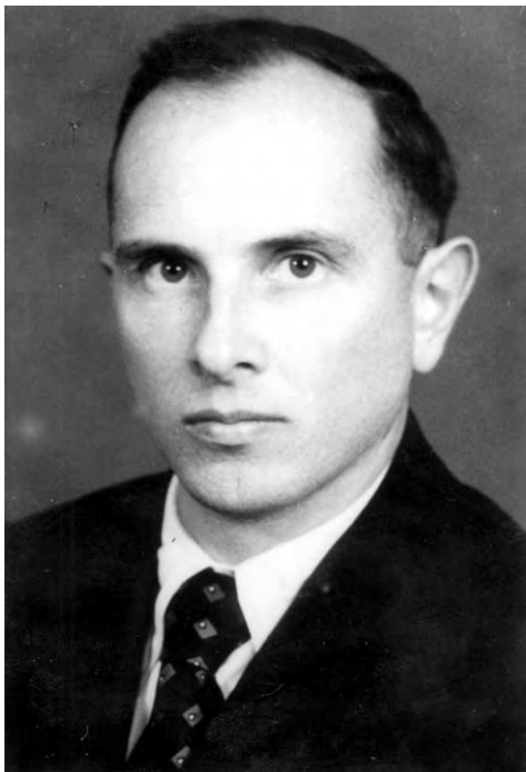
Степан Бандера, 1946 р.

Особі цього діяча присвячено багато праць, але зробити належний аналіз його діяльності та визначити його місце в історії українська історична наука ще не спромоглася. Сучасним дослідникам належить дати ґрунтовну оцінку Степанові Бандері як людині, теоретикові й інтерпретатору націоналістичної ідеології, організаторові й лідеру ОУН 1930—1950 рр. В історіографії перебування С. Бандери в ув'язненні є зовсім недослідженими та оповиті різними міфами, особливо в концтаборі Заксенгаузен в 1942—1944 рр.