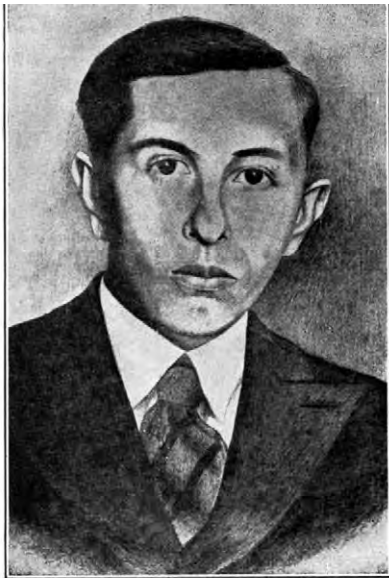
“Згинути, а не зрадити!” “Нас розсудить залізо й кров!” (СТЕПАН БАНДЕРА, член ОУН, засуджений на досмертю тюрму в варшавському процесі)

всю пивницю, але було видно, що вікон не було. Був тільки отвір у стіні дуже високо, заґратований грубими залізними ґратами, який виходив на той коридор, звідки я прийшов. Між тим отвором і дверима була округла висока піч, що могла б зовсім добре бути прототипом теперішньої космічної ракети. Отвору не мала. Потім показалося, що в ній палиться з коридору. Обійшовши піч, побачив я характеристичний для тюрми на “Святім Хресті” кібель (парашу). Це був великий, проміром на дві треті метра, валець, високий на три чверті метра. Тому що був з грубого металу, був сильний і тяжкий. Зверху мав менший отвір зі щільною накривкою, який був у більшій на цілий промір накривці, що відкривав-