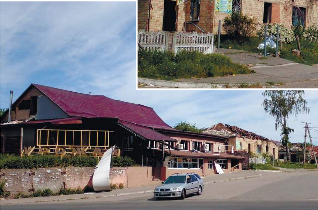
Руйнування центру села Бишів Фастівського р-ну Київської обл. Березень 2022 р.