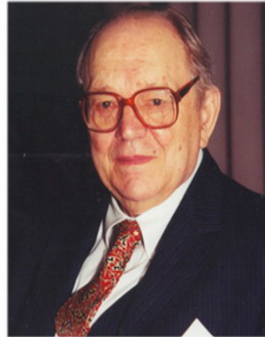
Омелян Прицак (1919–2006)

У центрі уваги вченого також була мова. Це був виразний наслідок філологічних захоплень молодого дослідника, навіяних ще в 1940-х роках професором Хансом Шедером. В автобіографії Прицак зазначав: “Шедер мене переконав, що історик середньовіччя – а таким я тепер ставав, хоч в центрі моєї уваги не була виключно Україна, а й Середня Азія з її пів-кочовими імперіями – мусить бути разом філологом. Бо тільки уважний філологічний аналіз джерела відкриває – навіть якщо на невеликі фрагменти – код думок тих, хто залишили свої писані свідoctва. А крім того – сама мова є дуже важне джерело для пізнання оригінальності даної культурно-політичної спільності” 5 .