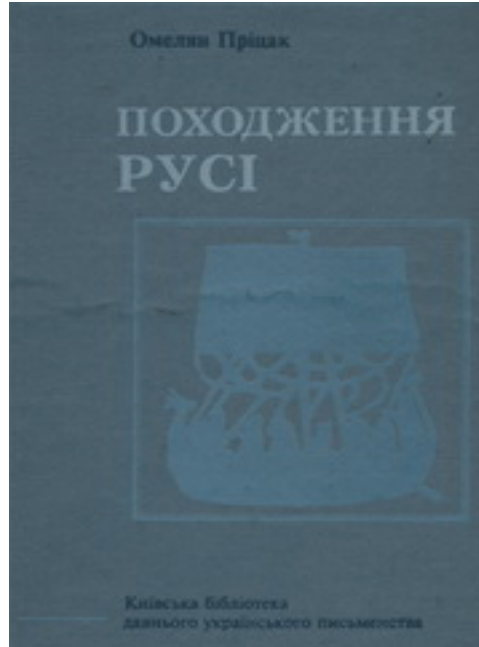
Обкладинка першого україномовного тому “Походження Русі” Омеляна Пріцака (Київ, 1997). Авторизований переклад з англійської Олександра Буценка та Юрія Олійника

Отже, основна ідея О. Пріцака з дослідження епіко-мітологічних потечних пам'яток полягала в тому, що, відповідно до настанов школи порівняльної мітології Ж. Дюмезіля, їх “можна належно зрозуміти лише за допомогою порівняльного структурного методу, без будь-якої історизації” 14 . Разом з тим у його праці доводиться можливість виокремлення надзвичайно