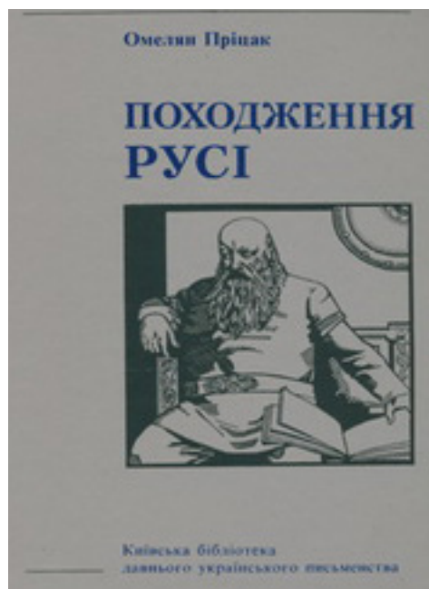
Обкладинка другого тому “Походження Русі” Омеляна Прицака (Київ, 2003). Видано тільки українською мовою.

Така само майстерність в аналізі ісландських саг з метою виявлення там достовірної історичної інформації Пріцак продемонстрував у другому томі “Походження Русі”. Розглядаючи саги як суто літературні твори, прозові, але близькі до епічних поем, учений окреслював межі їхнього значення як джерела. Пріцак постійно підкреслював, що саги не були історичним описом певних подій періоду становлення Русі, ані додатками