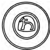
Мал. 10. Печатка пана Мишка Вигайловича 1510 р.