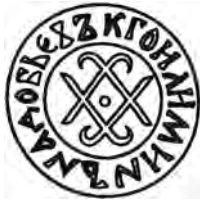
Мал. 1. Печатка пана Голіміна Надобовича 1434 р.