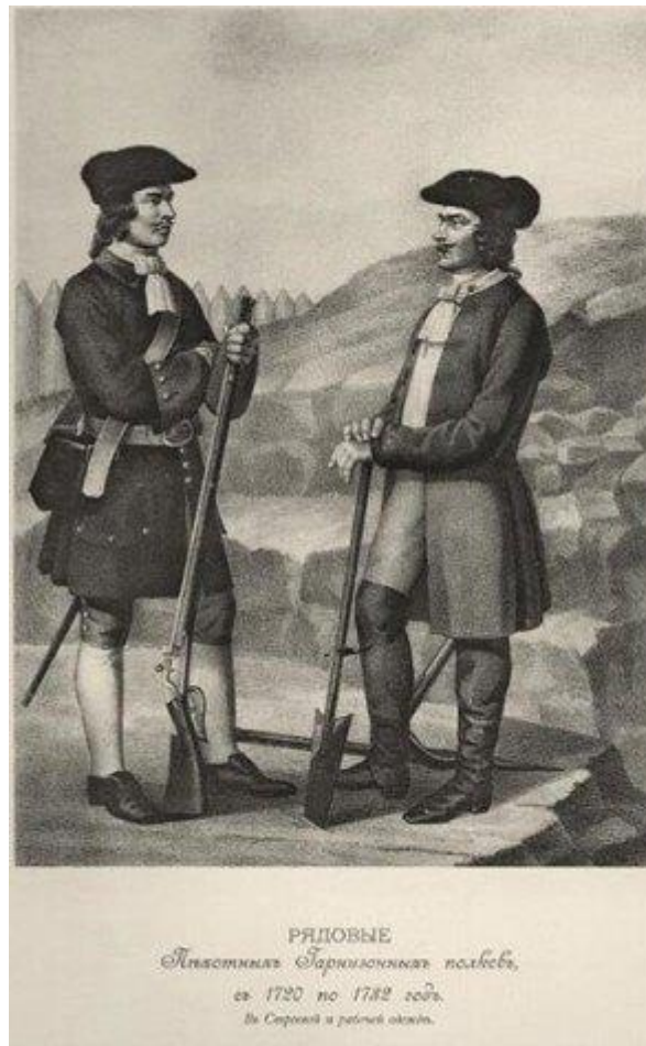
Рядові гарнізонних піхотних полків російської армії в 1720 –1732 рр. (зліва в стрійовій уніформі, справа – в робочій)