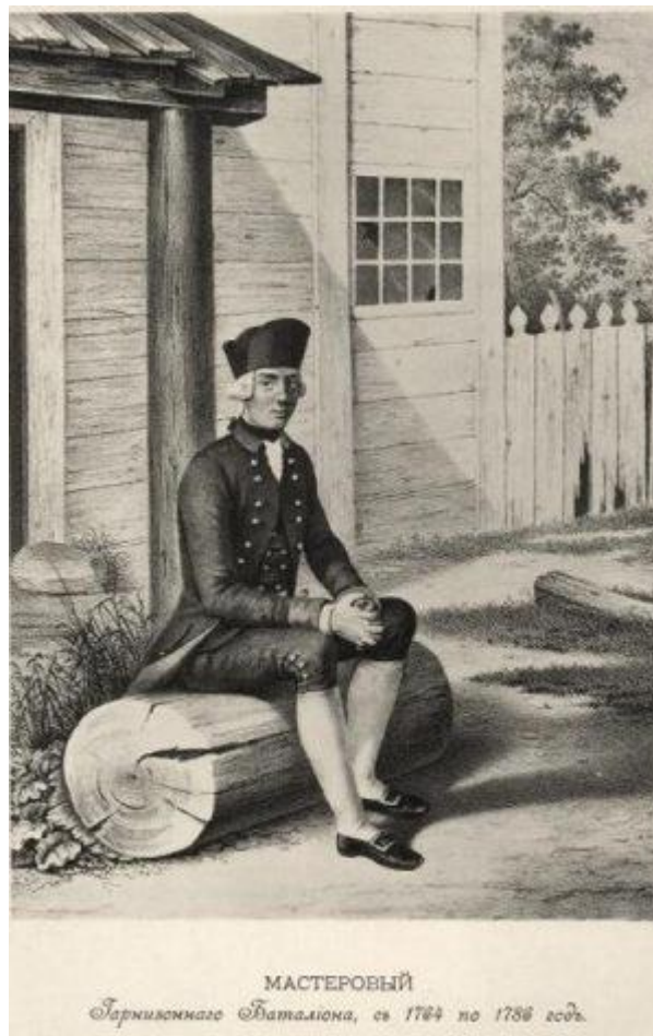
Майстровий гарнізонного батальйону з 1764 по 1786 рр.

Окрім легальних і напівлегальних шляхів покращення майнового стану, російські військові часто мали і нелегальні шляхи збагачення. Так, київські рейтари, які у XVIII ст. часто їздили у відрядження, мали багато можливостей для додаткового заробітку. Основним їхнім службовим завданням була доставка дипломатичної пошти. Під час своїх відряджень ці кур'єри не лише доставляли дипломатичну пошту, але й листи та посилки від приватних осіб, за що отримували винагороду. До того ж рейтари займалися контрабандною товарів 44 .