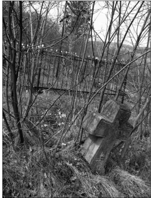
Іл. 7. Старе кладовище на центральній Бойківщині (с. Ямельниця Сколівського р-ну Львівської обл., ПМА 2019)

хреста, то дівчина з цієї хати ніколи не вийде заміж [61, с. 669], переважно взагалі остерігалися чіпати рештки надмогильних знаків («дерево зі старого хреста ніхто б не хотів спалити» [74, с. 85].