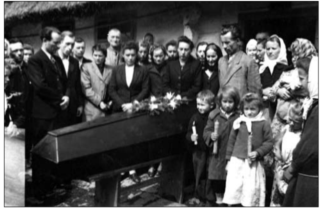
Іл. 1. Похорон на Центральній Бойківщині, 40—50-ті рр. ХХ ст. (с. Урич Сколівського р-ну Львівської обл.). публікується вперше [53, ф. 77]

міг би вразити присутніх своїм смертоносним поглядом [26, с. 97] (гуцули також вірили, що через цю дірку можна побачити відьму) [59, с. 225]. Тріски з труни (хоч це і вважалося великим гріхом) інколи використовували у діях магічного характеру, наприклад, у мисливській магії 4 .