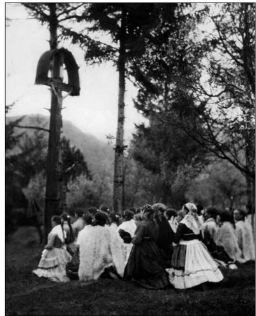
Іл. 3. Кам'яниця — на кладовищі, молитва перед хрестом, 1921 (Гуцульщина) [73, с. 71].