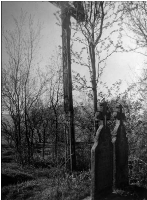
Іл. 5. Цвинтар у смт Великий Березний Закарпатської обл. Ілюстративний фонд бібліотеки Інституту народознавства НАН України, Інв. № 15180

дерева овочеві и смереки» [12, с. 189]; «щоб люди їли плоди і згадували небіжчика» [8, с. 111]; «...ї овочі з дерев, що ростуть коло гробів, не їдяться з такою насолодою, як з іншого місця» [74, с. 85]), де що рідше — ялини і горобину [75, с. 436] (іл. 4—5). Особливо тривало і розлого цей звичай зберігся на Поліссі, де й зараз на старих кладовищах можна побачити на могилі дерево поруч із хрестом. Щоправда, поліщуки в цьому випадку надавали перевагу дикорослим породам дерев. Натомість на Волині, так само, як і в Карпатах, на кладовищах садили здебільшого плодове дерева [85, с. 291].