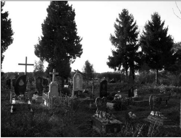
Іл. 4. Цвинтар на прибойківському Підгір'ї (ПМА, 2019)