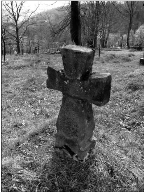
Іл. 6. Старе кладовище на центральній Бойківщині (с. Ямельниця Сколівського р-ну Львівської обл., ПМА 2019)

Також на території українських Карпат доволі поширеними були стовпоподібні надмогильні фігури, що за своєю формою взагалі мало нагадували хрести, швидше антропоморфне чи фітоморфне зображення. На думку Миколи Моздира, «образно такий хрест більше уподібнюється до стрункої тополі, що, знову ж таки, дає привід для вбачання у них відголоску давнього культу дерева» [71, с. 239—240]. Також у Карпатах побутували хрестоподібні надмогильні фігури, що завдяки стрижню та боковим виступам різної форми, на думку М. Станкевича, швидше асоціювалися саме із деревами (іл. 8), і більше ніж канонічні багатораменні хрести надавалися до ознакування і запам'ятовування могили, без застосування письма, та кращого її розпізнавання принаймні протягом трьох поколінь [81, с. 716—717]. Деякі дослідники, проте, вбачають у таких надмогильних знаках антропоморфні фігури, що, проте, не суперечить ідеї, мотиву поєднання людини і дерева, що ми так часто бачимо на прикладі традиційної обрядовості Карпат, та на пам'ятках декоративно-ужиткового мистецтва.