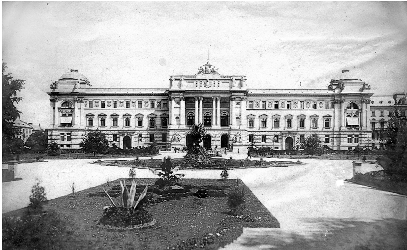
Ілюстрація 1. Будинок Галицького крайового сейму. Перед 1898 р.