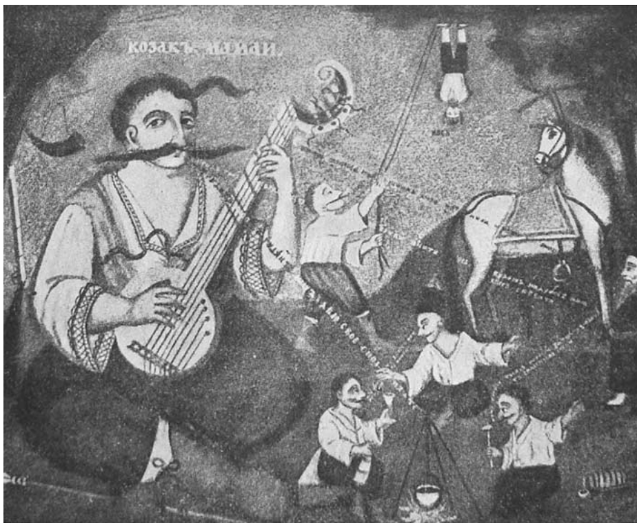
Козак Мамай в іпостасях за різними виправами. Народна картина 2-ої половини XVIII ст.