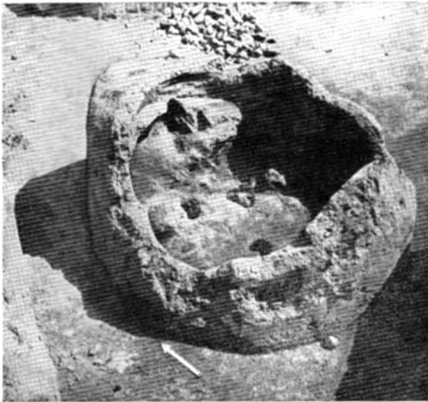
Рис. 2. Горно № 1 з Белгорода Київського.

дяться розкопки на його дитинці і посаді. Виявлено понад 40 стародавніх жител, чимало господарських та виробничих приміщень та безліч різноманітних знахідок. Результати цих досліджень опубліковано у ряді статей 1 .