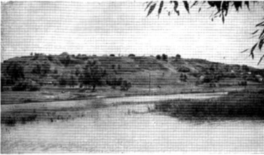
Рис. 1. Загальний вигляд Белгорода.