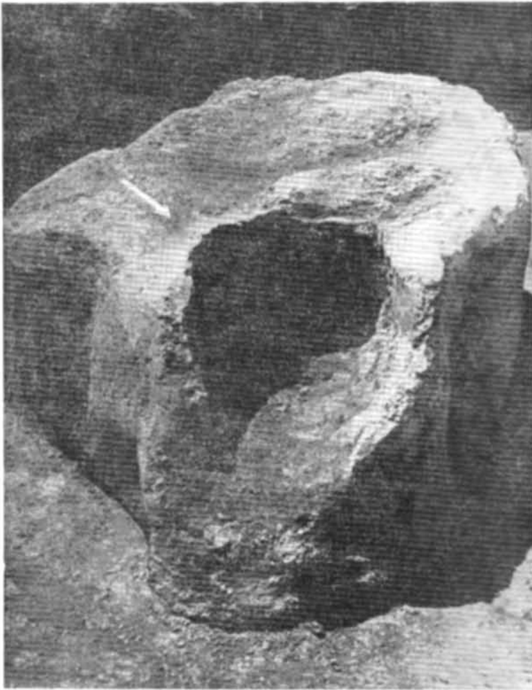
Рис. 3. Горно № 2 з Белгорода Київського.

Привертає увагу керамічне виробництво, оскільки воно є важливим показником для визначення економічного розвитку міста. Про