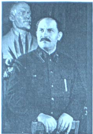
Лазар Каганович – член політбюро ЦК ВКП(б)