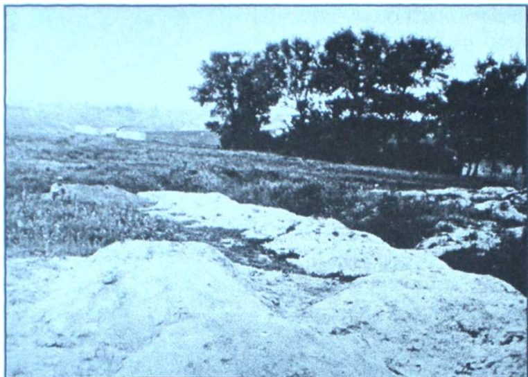
Масові поховання померлих. Харківщина. 1933 р.

У вересні 1933 р. до школи не прийшли 52% школярів Остерського, 70% Варвинського, 77% Березанського, 74% Коропського, 54% Мало-Дівицького районів Чернігівської області. Значна частина з них померла, а решта лежала пухлими або поповнила лави безпритульних. До школи не прийшло від 93 до 98% вчителів у Варвинському, Березнянському, Мало-Дівицькому та Менському районах, які не мали централізованого постачання та матеріальної підтримки від колгоспів. Укрколгоспцентр зобов'язав забезпечувати сільських педагогів лише за умов, якщо район було колективізовано на 68%.