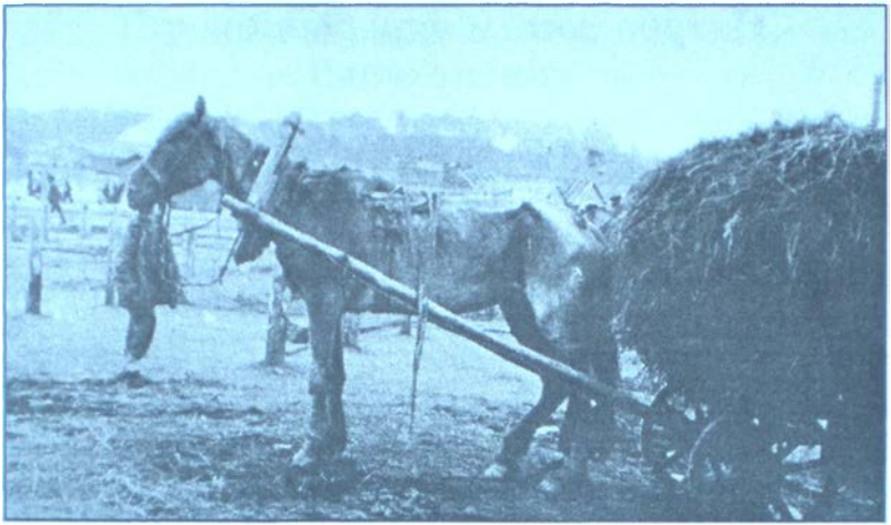
Коні не винні... 1933 р.

тивельну. Головний комуніст України визнав основну причину виснаження коней: “особливо багато ганяли коней всю осінь і зиму по перевезенню хліба, буряків і т. ін” . Коні дохли від роботи, тому що не встигали вивозити щойно вилучений у їхніх господарів хліб, а селяни помирали, позаяк у них забрали харчі. Дійшло до того, що четвірка коней не могла заборонувати два гектари землі протягом дня. Вони дохли на полях, де їх жадібно поїдали голодні селяни. Також коні вимерзали від холоду й голоду у непристосованих колгоспних хлівах. Навесні 1932 р. Москва вимагала від України 130 тис. т м'яса, а спочатку планувала взагалі 181 тис. т. План по країні становив 716 тис. т. Отже, рівно четверта частина обсягу союзних м'ясозаготівель припадала на Україну. З жовтня 1930 по вересень 1931 р. з УСРР вивезли 220 тис. голів великої рогатої худоби, 97 тис. свиней та понад 8 тис. овець. Основний тягар лягав на так званих куркулів. Весною 1931 р. їхня частка республіканського обсягу заготівель м'яса становила 37%. До холодильних камер