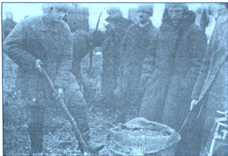
Голодні селяни у пошуках їжі. 1933 р.

госпах, “повністю припинити видачу будь-яких натуровансів в усіх колгоспах, що незадовільно виконують план хлібозаготівель” , організувати повернення хліба, виданого для громадського харчування, вилучити в окремих колгоспників та одноосібників хліб, украдений ними під час жнив. У колгоспах, які не виконували плану хлібозаготівель, влаштовували публічний обмолот зернових з присадибної ділянки колгоспника, зараховуючи її як видачу на трудодні. Пропонувалося заносити колгоспи на “чорну дошку” , тобто впроваджувалася продовольча та комунікаційна ізоляція колгоспників сіл. 20 листопада 1932 р. Раднарком УСРР, виконуючи партійне рішення, видав постанову “Про заходи до посилення хлібозаготівель” , відтак партійно-радянський тандем засвідчив початок антигуманної акції, яка мала виразні ознаки геноциду.