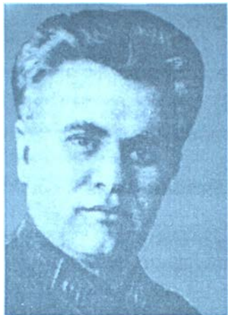
Всеволод Балицький – голова ГПУ УРСР