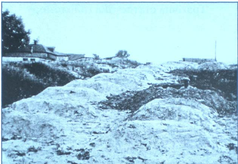
Масові поховання жертв голодомору на Харківщині. 1933 р.

кинули 213 учнів. У Межівському районі близько 2 тис. школярів, які народилися 1926 р., тобто мали на 1933 р. 7 років, не потрапило до школи. На Донеччині навесні 1933 р. поза школою опинилося понад 88 тис. учнів українців та 31 тис. росіян. На початку 1932/33 навчального року в області було 447 тис. учнів, а протягом року школу залишили 103 тис. дітей, тобто кожний четвертий. На Київщині початкову школу не відвідувала половина дітей.