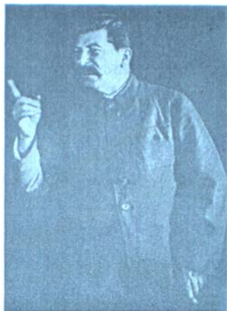
Йосиф Сталін – генеральний секретар ЦК ВКП(б)