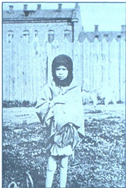
Опухла дитина. Харків. 1933 р.

На Дніпропетровщині, де голодомор охопив кожне село, факти людодідства фіксували районні управління ГПУ. У с. Константи́нівка Мелітопольського району “селянин-одноосібник”, якому було всього 20 років, спочатку харчувався трупом померлої матері, а трохи згодом – тілом померлої дитини, піля чого і сам помер. У квітні 1933 р. двоє братів та дружина спочатку зрізали колоски, бо так і не дочекалися розподілу хліба за трудовні, а потім з голоду вдалися до “полю-