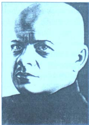
Станіслав Косіор – перший секретар ЦК КП(б)У