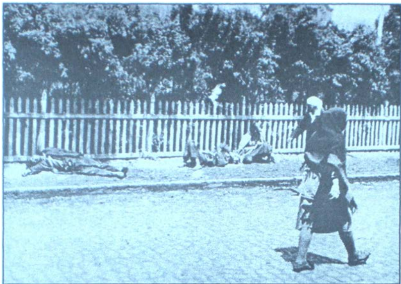
Жертви голодомору на вулицях Харкова. 1933 р.