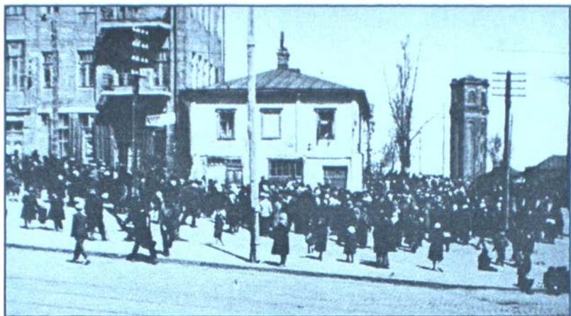
Магазин Торгсину. Черги за хлібом. Харків. 1933 р.

10 грудня 1932 р. політбюро ЦК КП(б)У ухвалило постанову “Про роботу “Торгсину”, якою запроваджувалася в системі ЦК партії посада керівника облконторами, а до номенклатури обкомів призначили директорів великих магазинів та баз. У січні 1933 р. було 74 магазини, а в серпні того ж року – 256, тобто торгсинівський павук широко розпустив свою золоту мережу, яка мала представництва майже у кожному районі. Наприклад, Коростенське відділення мало осередки в Овручі, Малині, Олевську та інших містах Полісся, зв’язаних залізницями.