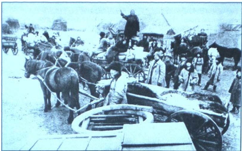
Пошук селянського хліба. 1933 р.

чинити свавілля та знущання над селянами, які не виконують своїх зобов'язань. Селян-одноосібників штрафували, позбавляли земельного наділу, садиби, виселяли поза межі району та області, конфісковували майно. Держава не дбала про селян, вважала їх “ворожим елементом” , забороняла торгувати, не видавала кредиту, насіння. Фактично їх перетворили на кріпаків.