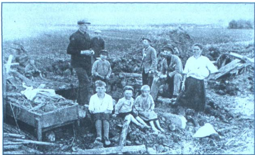
Залишилися без хліба і хати. 1933 р.

на роботу. “Колгоспники, які працювали і заробили багато трудоднів, – писав Сталіну учень з Голубінського рудника, – зараз голодують і немає чого їсти, наприклад, у моїх батьків було 805 трудоднів та заробили хліба зі своєю сім’єю по 105 пудів, а одержали з колгоспу грошей та 46 пудів хліба, а решту хліба вивезли в план хлібозаготівель. Грошей так само чомусь не дають і таким чином ми залишилися голодні” . Подібних листів було безліч. Лише до приймальні М. Калініна їх надійшло близько 35 тисяч. Колгоспний трудовдень виявився “паперовим”. До всього, секретаріат ВУЦВКу вважав правильною відмову видавати хліб непрацездатним колгоспникам.