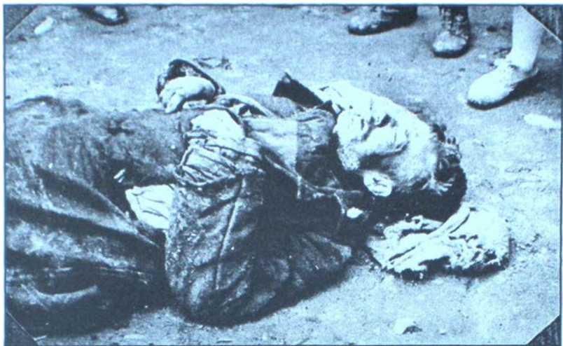
Жертва голодомору. Харків. 1933 р.

кварталу 1932 р. надійшло 2,6, другого – 3,6, третього – 3,2, а в четвертому кварталі – 1,4 млн. валютних карбованців, тобто близько 11 млн. валюти. Гроші надходили з Америки, Німеччини, Польщі, Франції, Палестини, Китаю, Туреччини, Італії та інших країн. М. Фрумкін дозволив торгсинівським структурам здавати за валюту в оренду квартири в Москві, Тифлісі, Харкові, Києві, Вінниці, Мінську. Квартири продавали лише членам житлової кооперації, а іноземцям здавали в оренду, але за погодженням з НКВС та Наркоматом іноземних справ.