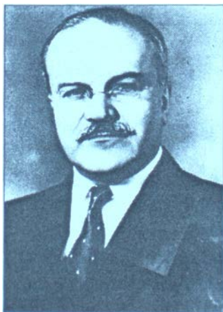
В'ячеслав Молотов – голова Раднаркому СРСР