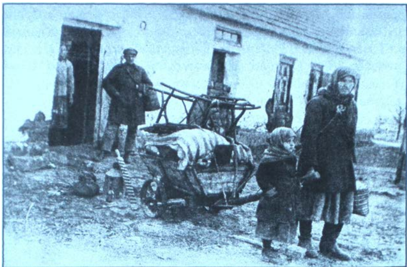
У пошуках кращої долі. 1933 р.

фіївка Близнецівського району Дніпропетровської округи загальні збори села відмовились від створення колгоспу, висунувши на порядок денний питання: “Хто за радянську владу?” . Більшість проголосувала проти.