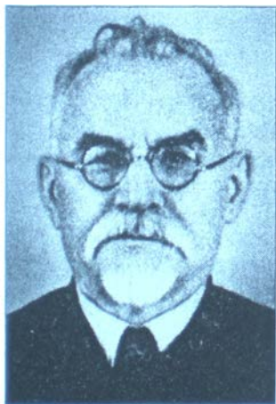
Григорій Петровський – голова ВУЦВК