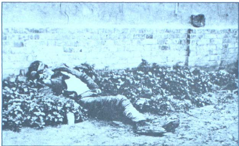
Жертва голодомору. Харків. 1933 р.

потрапило 7,2 млн. т. Для збільшення обсягів вилучення м'яса Раднарком УСРР заборонив з грудня 1932 р. торгівлю м'ясом та худобою, а також встановив “норми здавання по м'ясу для окремих господарств одноосібників і колгоспників” : від 20 до 45 кг живої ваги з двору. Протягом року селянин мусив здати державі від 160 до 225 літрів молока.