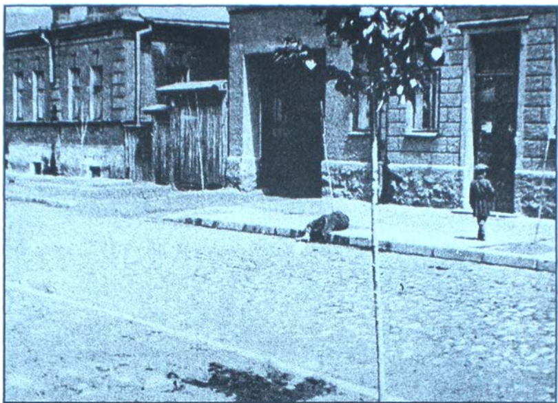
Жертва голодомору. Харків. 1933 р.

обкому КП(б)У Роман Терехов, звітуючись про виконання хлібозаготівель в області, назвав лише 15 районів, які виконали на 5 січня 1933 р. хлібозаготівельні плани, отже, решта господарств районів вважалася “саботажниками”, відтак на них поширювалися акції “чорних дощок” та інші форми масового терору. На старий Новий рік (14 січня) він особисто підписав постанову по посиленню хлібозаготівель та репресій у колгоспах, занесених на “чорну дошку”. Із 25 колгоспів області, які опинилися на них, лише три виконали план хлібозаготівель, а решта мали від 33% до 49% виконання, відтак масовий терор тривав. Обком рекомендував районам “ зламати саботаж хлібозаготівель у колгоспах ”, “ натравити на них усіх чесних колгоспників, що виконали плани ”.