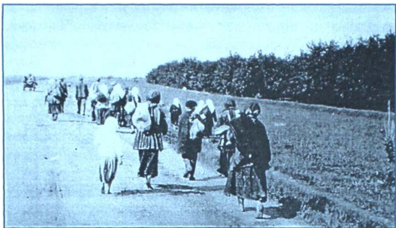
Голодні селяни у пошуках їжі. 1933 р.

до райцентру, вимагаючи звільнити арештованих односельчан. Збройна боротьба повстанців з військами ГПУ тривала в селах Томашпільського, Соболевського, Джулинського районів. У с. Тропова Лучинецького району Могильовської округи селяни ліквідували сільраду, обрали старосту, ухвалили рішення про страту 10 комсомольців. Військовий загін ГПУ придушив селянське повстання, арештував 28 осіб, але боротьба продовжувалася.