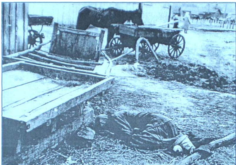
Жертва голодомору. Харків. 1933 р.

Нижньосироватська сільрада забрала у мене корову без всяких повідомлень, і заборгованості за мною немає, яким я вважаю, що у мене узято корову невірно". Таких випадків було безліч.