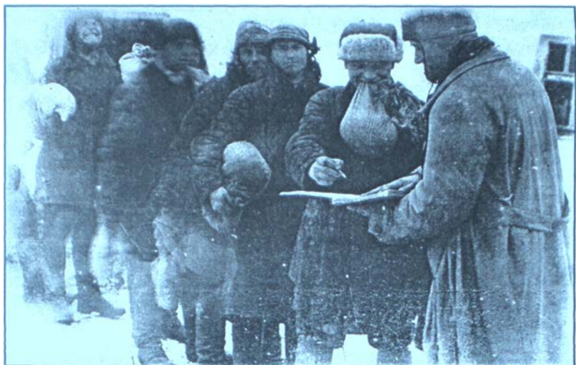
Розподіл хліба на трудодні. 1933 р.

жодного кілограма хліба. У березні 1932 р. Вінницький обком КП(б)У інформував Станіслава Косіора про те, що 42% колгоспів області лише частково розрахувалися з колгоспниками за трудодні, а 8 районів взагалі не розподілили ні центнера. 28 березня 1932 р. політбюро ЦК КП(б)У зобов'язало Наркомзем та Укрколгоспцентр повністю завершити розподіл за трудоднями до початку посівної кампанії.