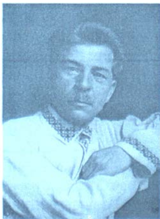
Павло Постишев – другий секретар ЦК КП(б)У