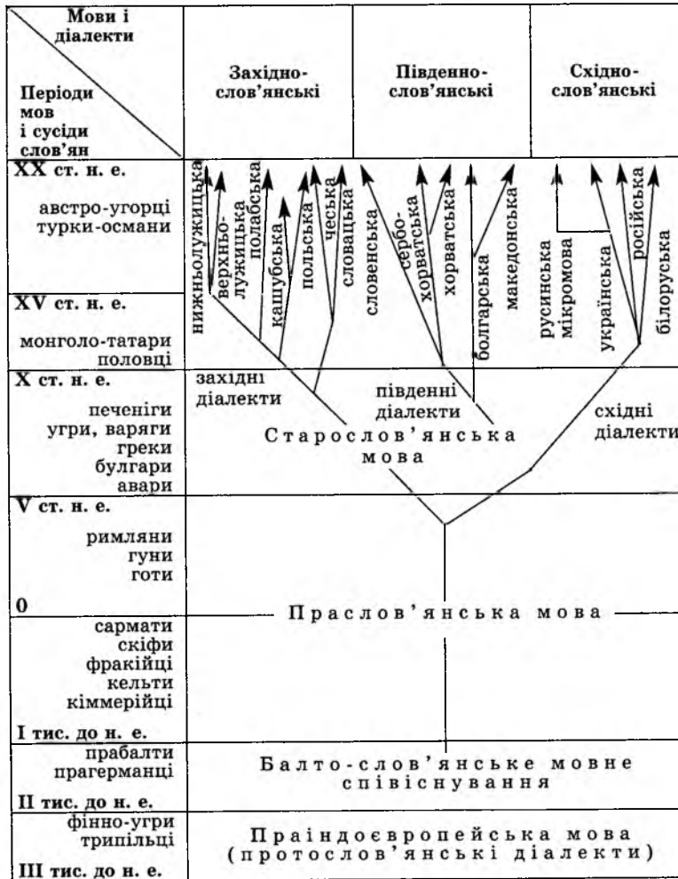
Рис. 2.1. Розвиток і класифікація слов'янських мов

З огляду на основні фонетичні типи рефлексів праслов'янських звукосполук, територіальну поширеність мов, культурно-історичні зв'язки народів більшість сучасних учених визнає тричленну класифікацію слов'янських мов (рис. 2.1).