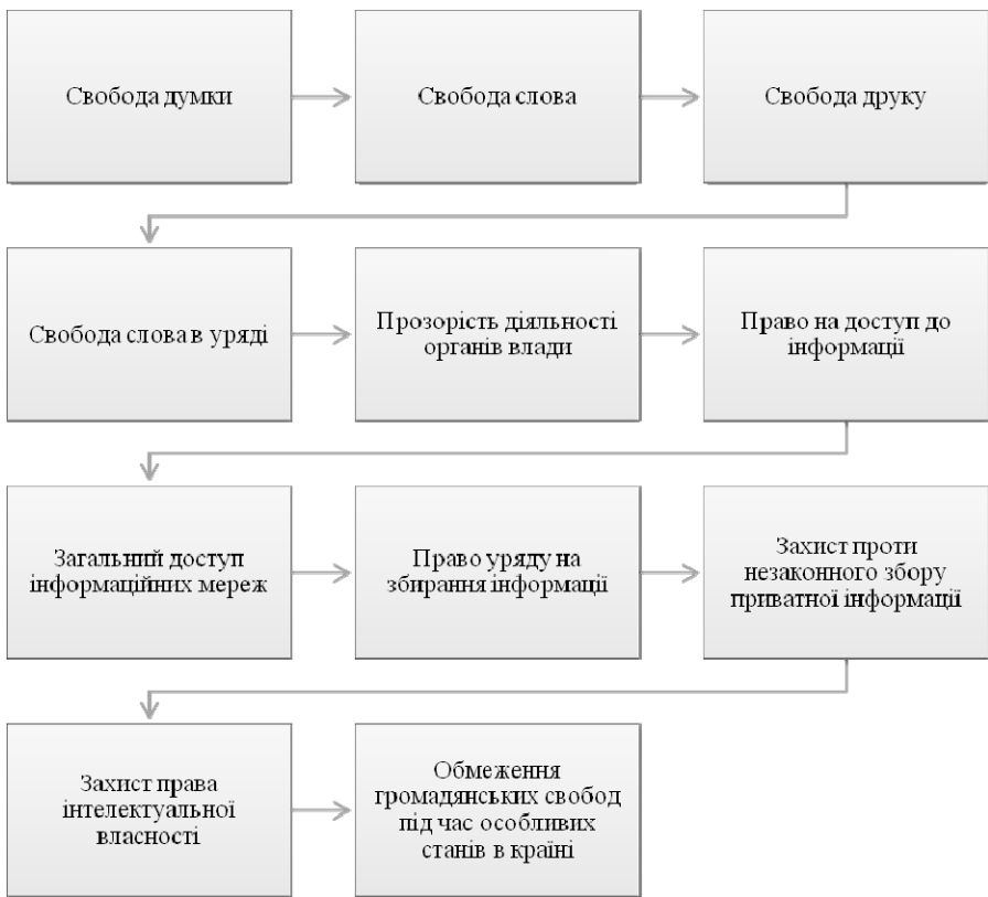
Рис. 2. Базові принципи інформаційної політики США

У той же час, концепція національної інформаційної політики США ставить завдання розширення і вдосконалення інформаційного простору, посилення свого впливу в таких регіонах, як Латинська Америка, Центральна і Східна Європа, країни Арабського світу та Азійсько-Тихоокеанського регіону. США запропонували доктрину “інформаційної парасольки” міжнародного співробітництва з широким колом країн у різних регіонах світу, суть якої у превентивній комунікації на основі переміщення масивів інформації, що передається США державам-реципієнтам для забезпечення їх національних інтересів і, як наслідок, збереження лідерства США в політичній системі міжнародних відносин.