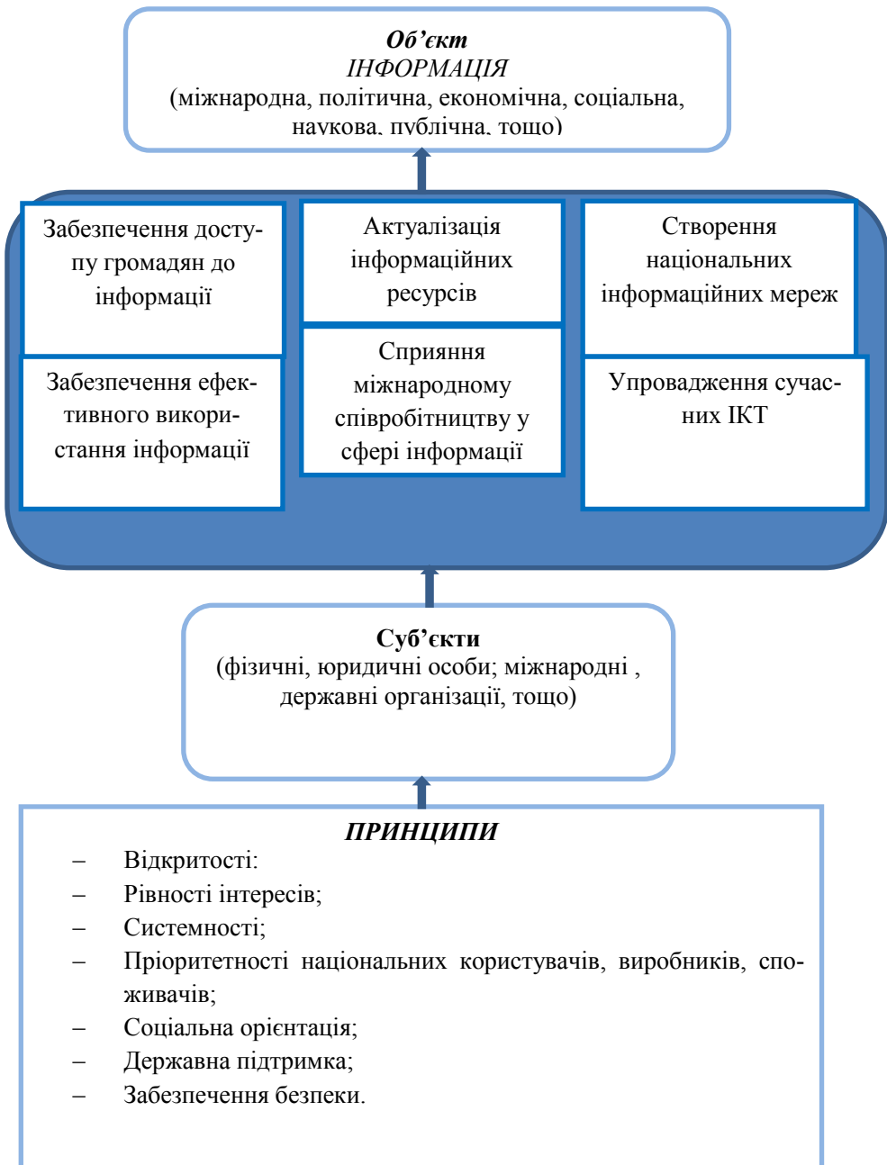
Рис. 1. Узагальнена модель державної інформаційної політики

У своїй праці [4, с. 8] В. Пожуєв детально розкриває базові принципи інформаційної політики, але не приділяє уваги негативним аспектам цього феномену [9, с. 8]. Проте професор С. Браман окрім традиційного визначення поняття “інформаційна політика” розкриває його негативні характеристики через аналіз такого феномену нового тисячоліття як інформаційна держава. Зокрема, вона виділяє наступні соціальні впливи нових тенденцій інформаційної політики в інформаційній державі: