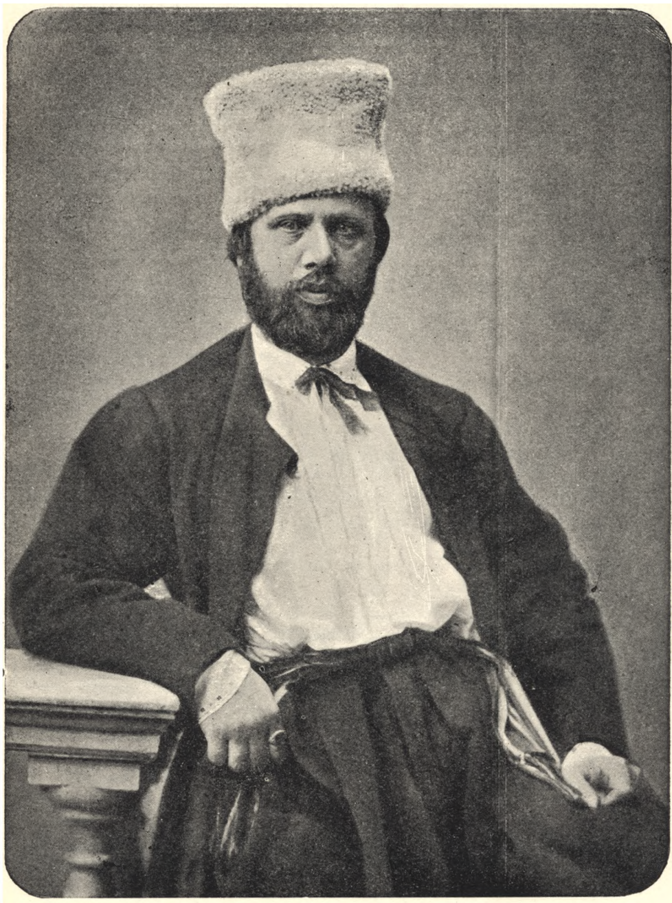
Михайло Матвієвич Лазаревський в 1860-х роках.