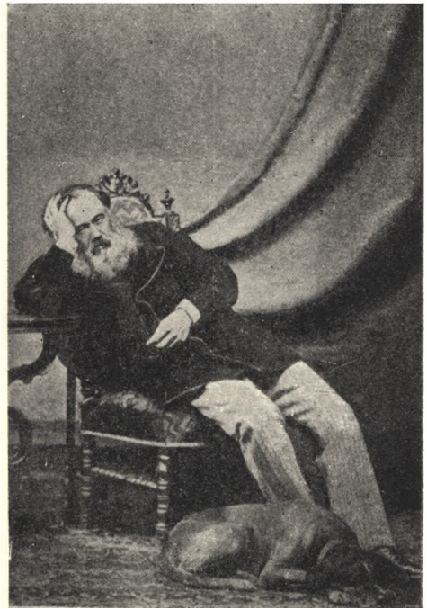
Василь Матвієвич Лазаревський.