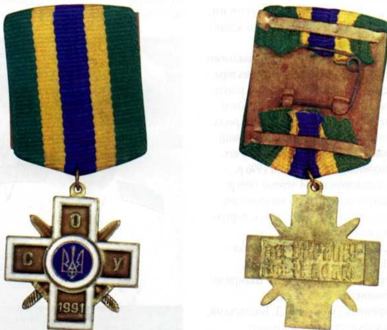
Медаль «5 років Спілки офіцерів України / Офіцерський Хрест з Мечами»

У 2007 р. Виконавчим комітетом Спілки офіцерів України було ухвалено рішення про затвердження «Хреста Заслуги Спілки офіцерів України» у трьох ступенях як постійної нагороди Спілки. Хрест Заслуги випуску 2006–2007 рр. є Хрестом Заслуги III ступеня. II ступінь Хреста Заслуги виготовлено з білого металу (нікелювання), по середині стрічки розміщено дві жовті смужки. Хрест Заслуги I ступеня виготовлено із латуні з позолотою, посередині стрічки розміщено одну широку жовту смужку. Хрест Заслуги I та II ступенів станом на 1 січня 2008 р. не виготовляли. Виготовлення планується у 2008 р.