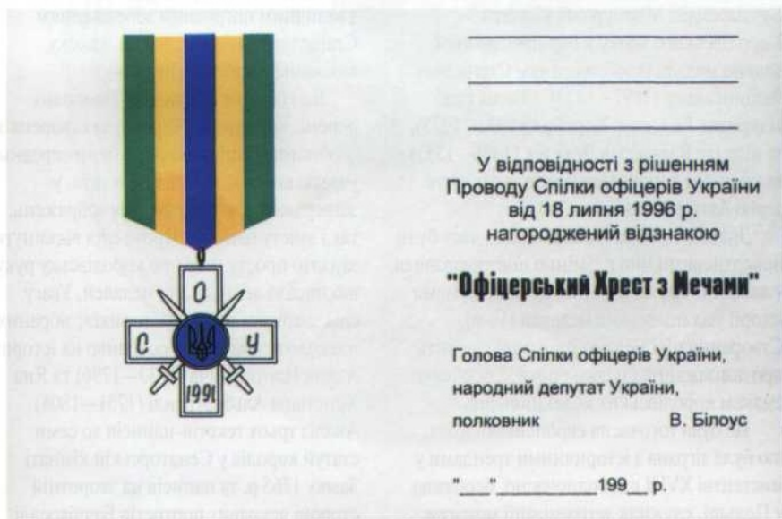
Посвідчення до медалі «5 років Спілки офіцерів України / Офіцерський Хрест з Мечами»