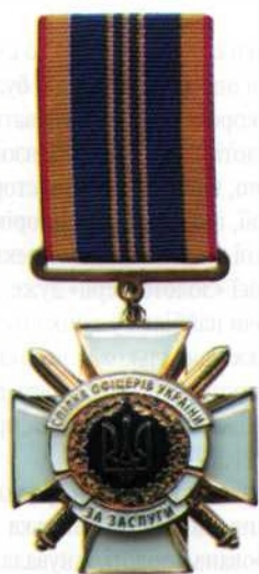
«Хрест Заслуги Спілки офіцерів України»