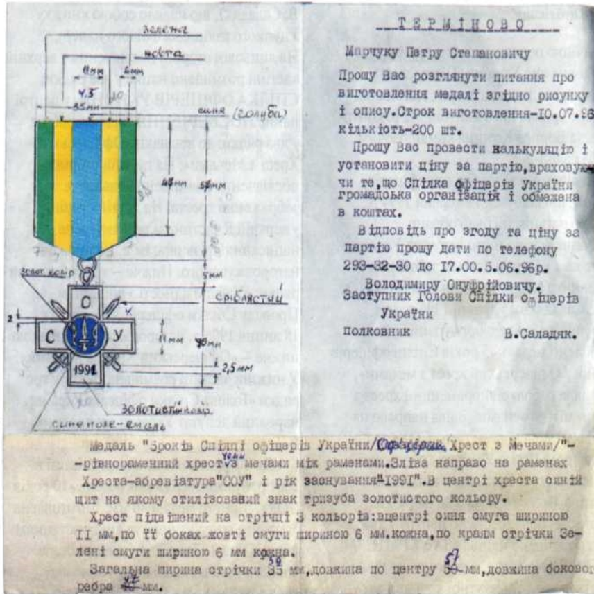
Проект листа на виготовлення медалі «5 років Спілки офіцерів України / Офіцерський Хрест з Мечами»

з рішенням виконавчого комітету Спілки офіцерів України з 2001 по 2003 р.