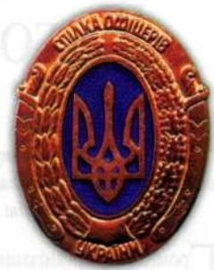
Знак Спілки офіцерів України (1-й та 2-й типи)