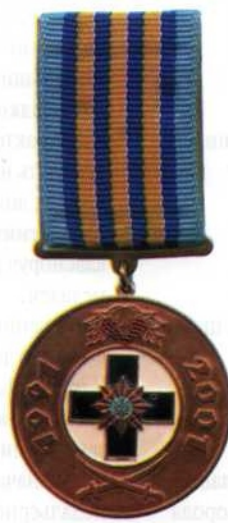
Медаль «10 років СОВУ»