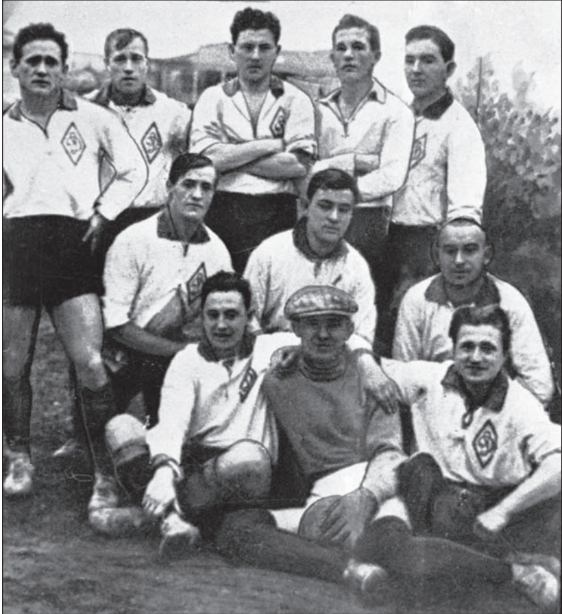
Перший склад київського «Динамо». Фото сфальсифіковане. На ній змиті зображення сімох українських чекістів — організаторів футбольної команди. При радянській владі свідомо спотворювалася і дата знімка — 1927, а не 1928 рік, як було насправді