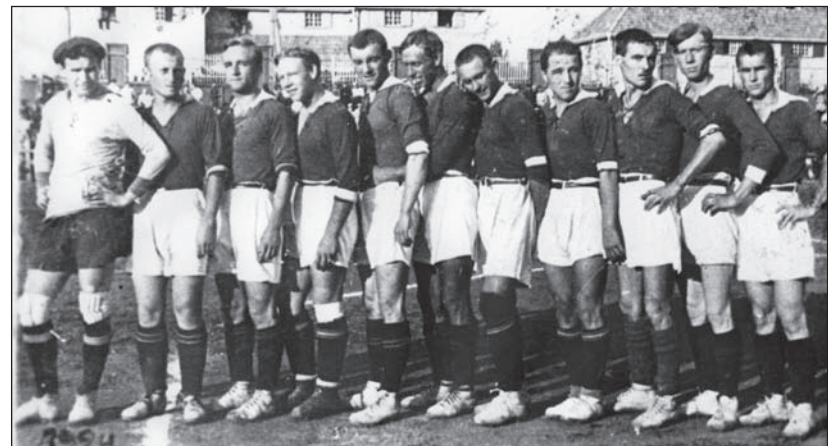
Збірна Харкова з футболу — краща в Україні середини 1920-х років. 1924 рік