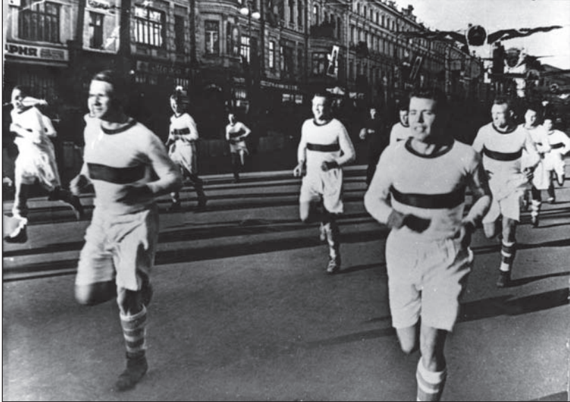
Динамівці Києва на Хрещатику під час першотравневої демонстрації 1937 року в столиці України