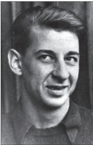
Таким запам'ятався сучасникам воротар Микола ТРУСЕВИЧ поза футбольним полем