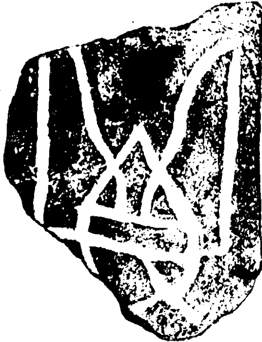
Новоархеологическій родовій знакъ на сиринѣ X в., найденный въ Кіевѣ въ 1907 г.

Геральдическое изслѣдованіе, предназначенное къ чтенію на XIV Археологическомъ Съѣздѣ въ г. Черниговѣ.