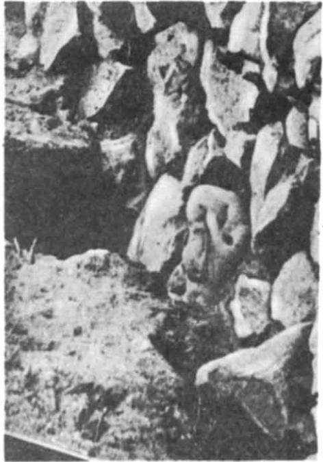
Рис. 4. Фрагмент фотографії з жіночою півпостаттю.

Відгуком на революційні події були його слова в одному з листів до М. Дроздова: «Дякувати Богові, що дозволив мені дожити до цих святкових днів і побачити моїх друзів і Поляків, і Українців, і Росіян вільними громадянами» 6 .