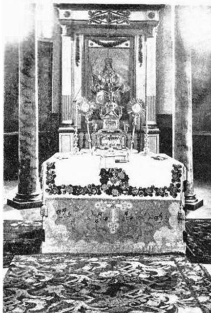
Рис. 2. Вівтар у соборі Різдва Богородиці