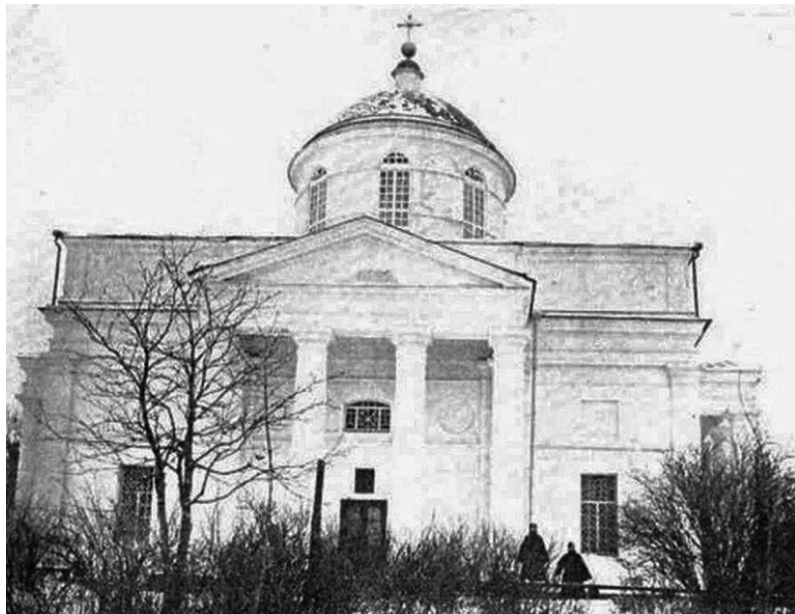
Рис. 1. Собор Різдва Богородиці Домницького монастиря