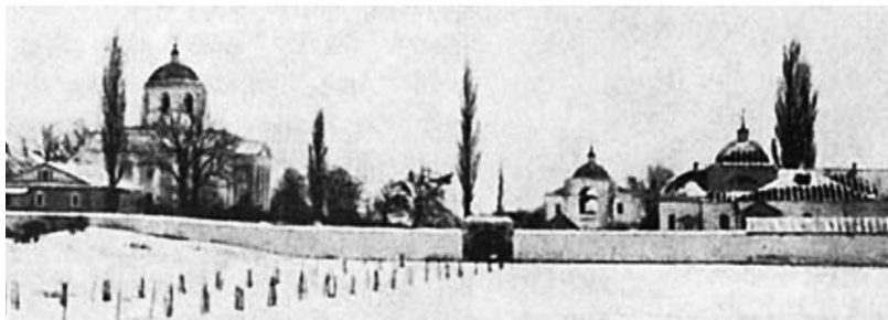
Рис. 3. Загальний вид на Домницький монастир