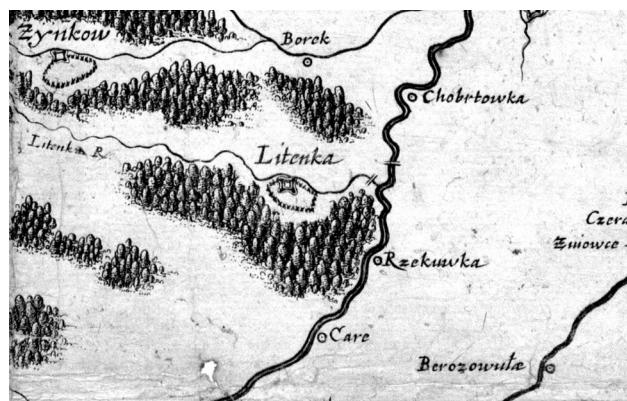
Село Care (Сари) на Спеціальній карті Боплана 1650 р.

Зрозуміти історію виникнення, розвитку та занепаду більшості з цих хуторів досить складно, адже частина джерел була втрачена. Особливо багато документів було знищено в роки Другої світової війни (наприклад, ті, що зберігалися в Полтавському обласному архіві). Друга складність – це розбіжності між назвами і кількістю хуторів, згадуваних у різних джерелах. Адже подекуди використовувалися більше двох назв для позначення одного хутора. Третя – це події XX ст., коли більшість із них зникли або були «укрупнені» в села. З приходом радянської влади, особливо під час колективізації (1929–1933), хутірський тип господарства засуджувався, людей таврували «односібниками». Голодомор 1932–1933 рр. винищив велику кількість мешканців хуторів. Частина людей переселили на інші терени. У 1950-х – 1970-х роках під час укрупнення населених пунктів багато хуторів зникло, злившись із більшими селами. Така політика не сприяла передачі родової пам'яті та інформації про історію рідного краю до наступних поколінь. Це призвело до того, що вже в XXI ст. старожили, що лишилися, не знають історії своїх рідних