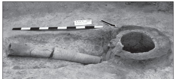
Рис. 1. Торговиця. Розкоп VIII, тандир

Лазня (розкоп IV) належить до споруд так званого східного типу ( hammam ). Розташована за близько 750 м на північний схід від центру села, з лівого боку від мосту через р. Синюха по трасі Кіровоград—Київ. Лазня була збудована на березі річки, за 41 м по прямій від плеса Синюхи. Добре помітний на поверхні куль-