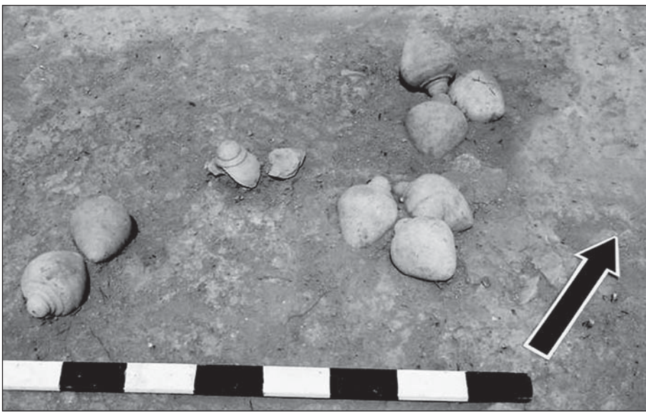
Рис. 2. Торговиця. Розкоп VIII, сфероконуси

турний шар складався з ґрунту, перемішаного з битою цеглою.