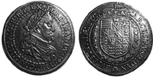
Рис. 8. Антикварна підробка. Штирія, Фердинанд II, талер 1624 року 19 .