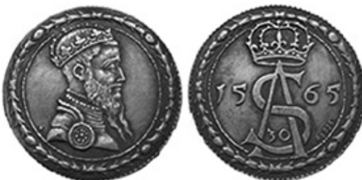
Рис. 2. Антикварна підробка. Велике князівство Литовське, Сигізмунд II Август. Полукопек, 30 гривів 1565 року 13 .