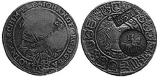
Рис. 9. Антикварна підробка. Московія, Олексій Михайлович, «сфімок з ознаками» 1655 року на талері курфюршества Саксонії за правління Йогана Георга, 1615 року 20 .