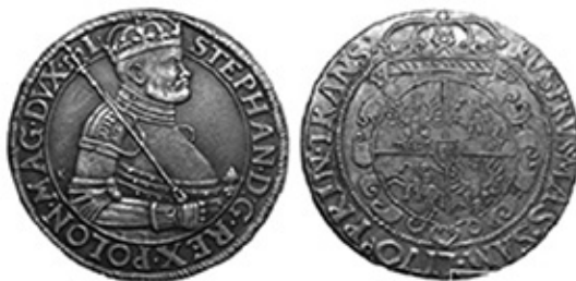
Рис. 1. Антикварна підробка. Річ Посполита. Стефан Баторій. Талер 1583 року 12 .