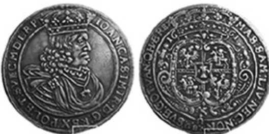
Рис. 3. Антикварна підробка. Річ Посполита, Ян II Казимир, талер 1661 року. м.д. Львів 14 .