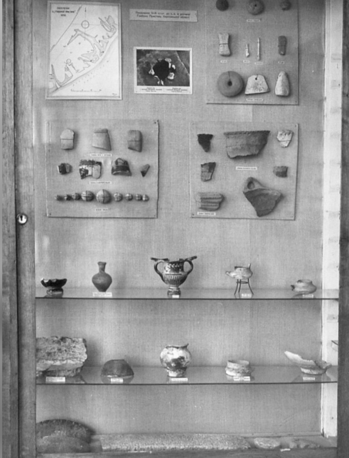
Вітрина з матеріалами Глибокої Пристані в збудованій під керівництвом Ізраїля Ратнера оглядовій експозиції музею на вул. Ушакова