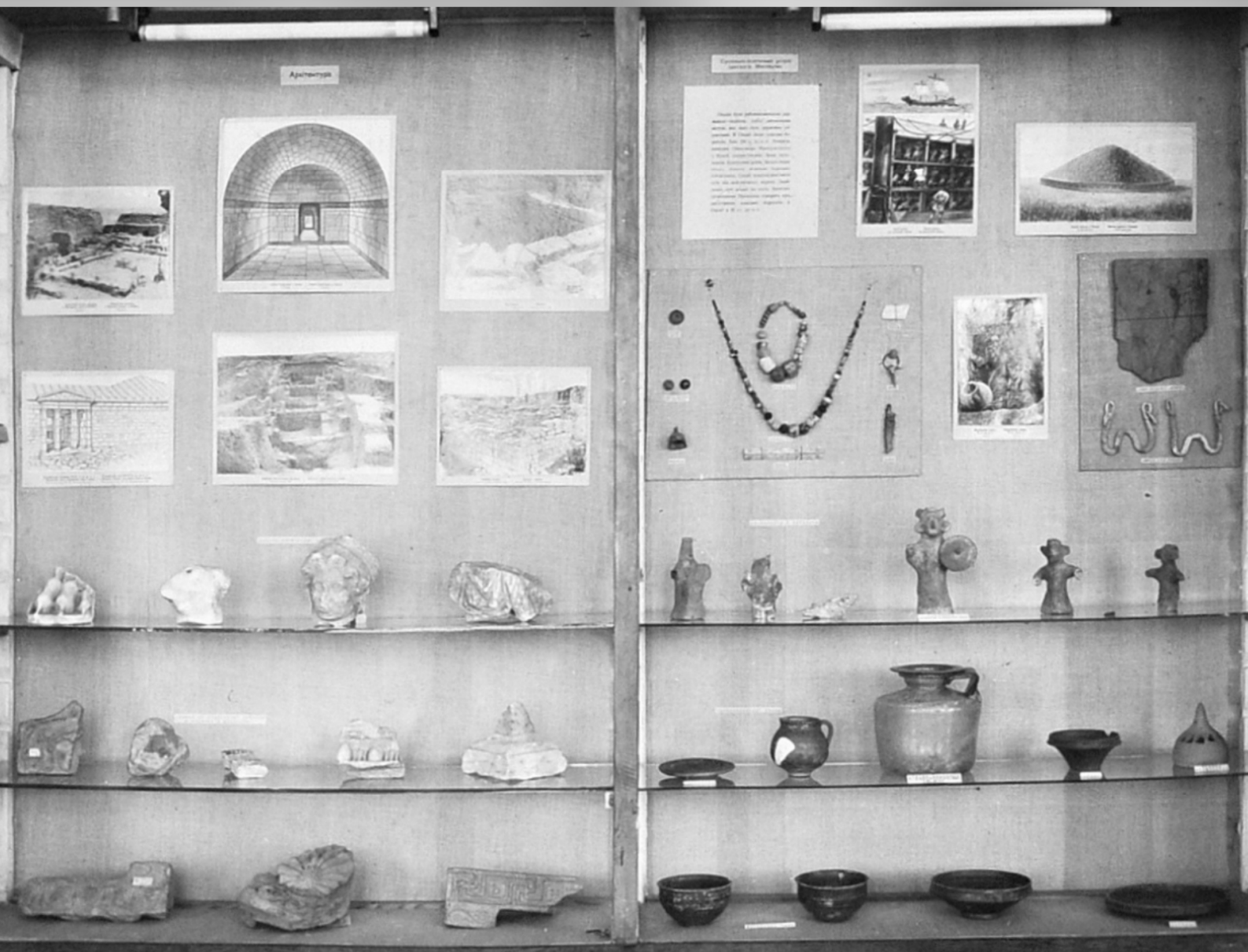
Вітрина з археологічними матеріалами античної доби з Ольвії в збудованій під керівництвом Ізраїля Ратнера оглядовій експозиції музею на вул. Ушакова