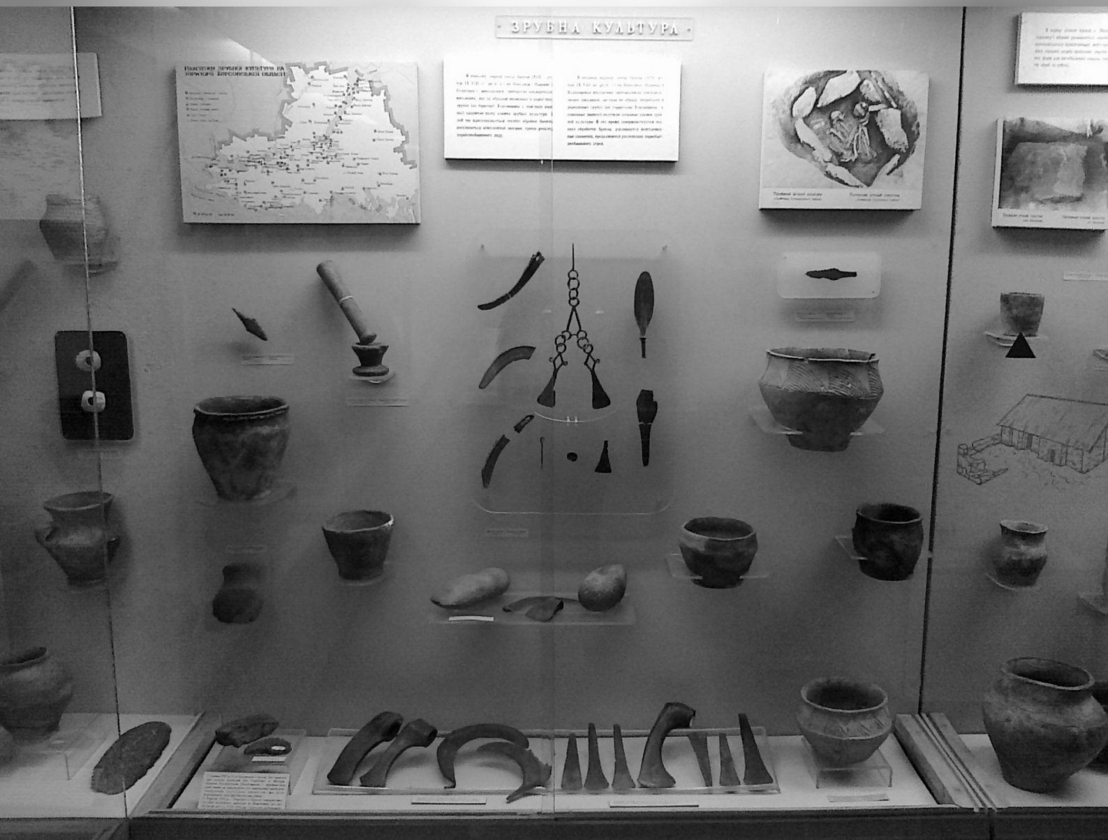
Вітрина з матеріалами зрубної археологічної культури в збудованій під керівництвом Ізраїля Ратнера оглядовій експозиції музею на вул. Леніна (Соборній)