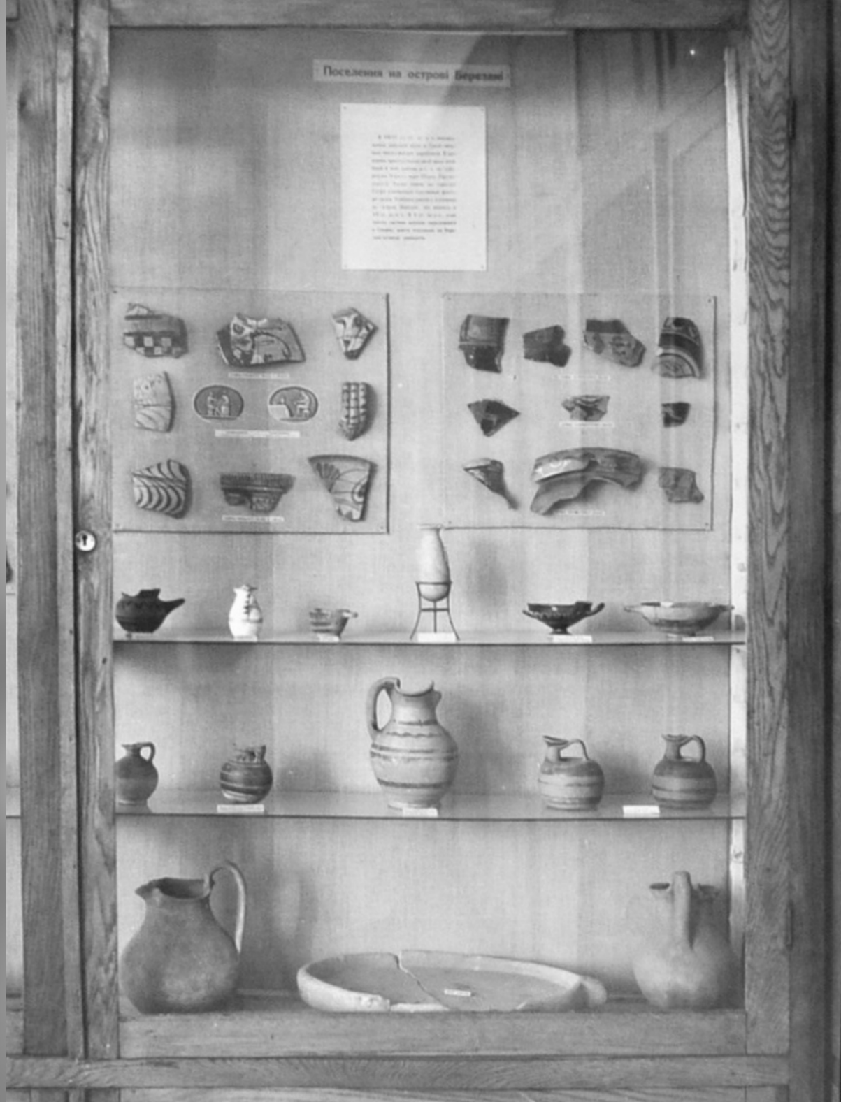
Вітрина з археологічними матеріалами античної доби з острова Березань в збудованій під керівництвом Ізраїля Ратнера оглядовій експозиції музею на вул. Ушакова