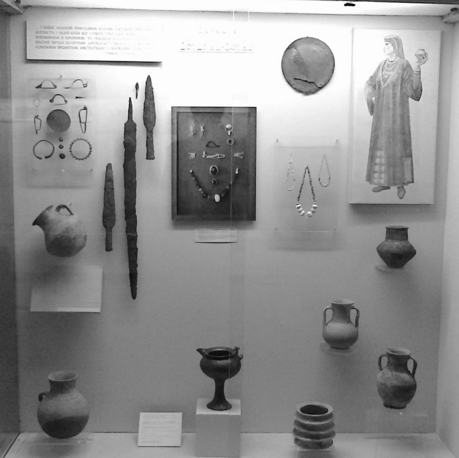
Вітрина з матеріалами сарматської доби в збудованій під керівництвом Ізраїля Ратнера оглядовій експозиції музею на вул. Леніна (Соборній)