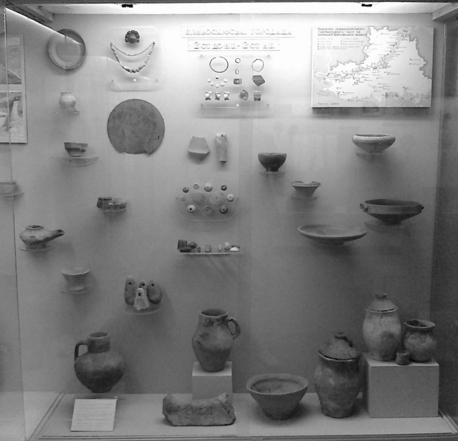
Вітрина з матеріалами пізньоскіфської (постскіфської) археологічної культури в збудованій під керівництвом Ізраїля Ратнера оглядовій експозиції музею на вул. Леніна (Соборній)